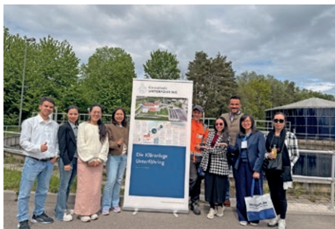
Eine Delegation aus Vietnam war am 7. Mai zu Gast an der Kläranlage.

Energieeffizienz und das Investieren in die gemeindliche Infrastruktur sind der Gemeinde Unterföhring große Anliegen. Deshalb hat die Gemeinde in die Belüftungstechnik der Klärbecken ihrer Kläranlage investiert. Seit der Instandsetzung und Modernisierung wurde der Energieverbrauch der Anlage um über 40 Prozent reduziert. Aus diesem Grund diente Unterföhring auch als Aushängeschild im Rahmen der IFAT Munich 2026. Die IFAT ist die Weltleitmesse für Umwelttechnologien und findet in der Regel alle zwei Jahre in München statt.