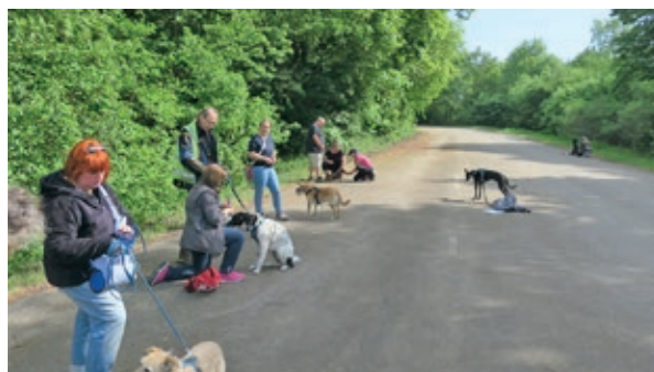
Die Teilnehmerinnen und Teilnehmer des Social Walks mit ihren Hunden.

Abgerundet wurde das konzentrierte Training durch einen gemeinsamen und ruhigen Spaziergang rund um das Helmholtz-Zentrum in Unterschleißheim, bei dem das Gelernte direkt in der Umgebung angewendet wurde. Wir freuen uns schon auf den nächsten Lernspaziergang am Sonntag, 14. Juni , bei dem es um Leinenführigkeit unter Ablenkung geht.