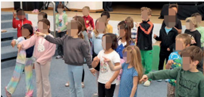
Die Klasse 1a sang und tanzte das Lied „Sei wie du bist“.