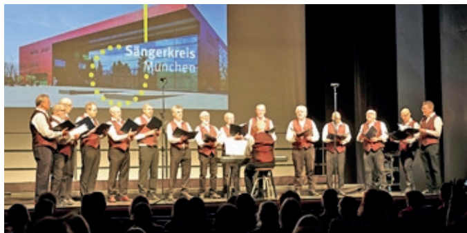
Die Unterföhringer Sänger als Co-Gastgeber beim „ChorIMPULS 2026“.

Das Dreieck Ismaning-Aschheim-Unterföhring ist auf engstem Raum die Hochburg aktiver traditioneller Männergesangsvereine im Gebiet des Bayerischen Sängerbundes. Vor zwei Wochen waren wir Unterföhringer Sänger auf dem gemeinsamen Nordost-Sängertreffen in Aschheim.