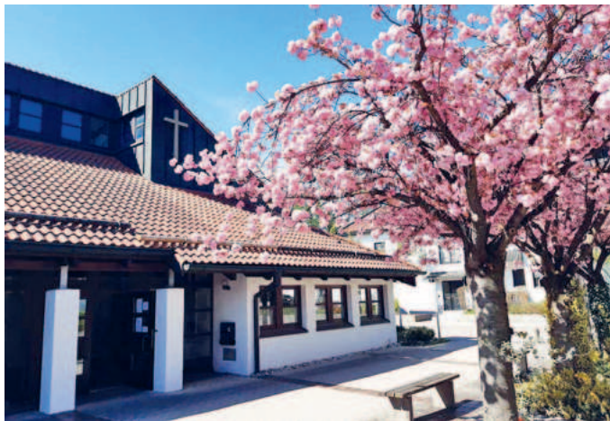
Evangelisches Gemeindezentrum in Unterföhring.

Herzliche Einladung zu diesem wichtigen Gemeindeabend am Dienstag, 19. Mai um 19.30 Uhr im evangelischen Gemeindezentrum der Rafaelkirche an der St. Florian-Straße 3. An diesem Abend wird der Kirchenvorstand uns über die aktuelle Situation unserer Kirche informieren. Welche Ideen und welche Schritte bereits gemacht wurden bzw. geplant sind. Darüber hinaus möchten wir mit Ihnen ins Gespräch kommen, denn Ihre Meinung ist gefragt und ist uns wichtig! Wir heißen sehr gerne alle Interessierten willkommen!