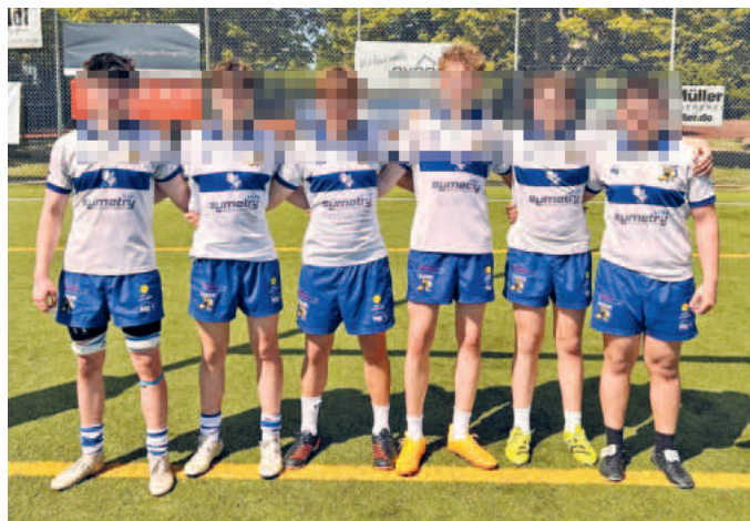
Die U16 schaffte den Einzug ins Halbfinale der Deutschen Meisterschaft.