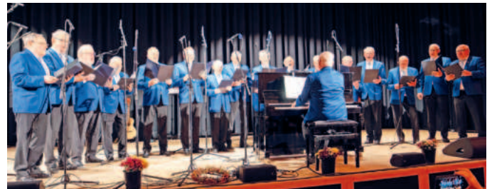
Auf der Bühne im Aschheimer Feststadl.

gelegt. Wenn es auf den Heimweg ging, heißt es wörtlich: „Nur die Kiebitze im Moos erhoben ein entrüstetes Geschrei über die geräuschvolle Gesellschaft, die durch ihr Revier zog“. Es ist halt für die Sänger ab und zu etwas später geworden, vielleicht sogar bis „die Sonn' erwacht“.