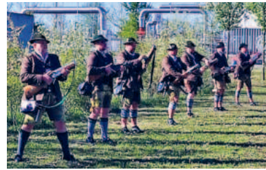
Die Böllerschützen beim Ehrensalut vor dem Feststadl.

mitglied ist - eingeladen und haben ihm zu Ehren in der vergangenen Woche bei strahlendem Sonnenschein einige Schussfolgen zum Besten gegeben.