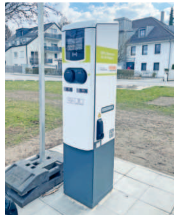
Drei neue AC-Ladesäulen dieser Art stehen nun in der Gemeinde zur Verfügung.

Für das Laden an den gemeindeeigenen Ladesäulen stehen verschiedene Möglichkeiten zur Verfügung: