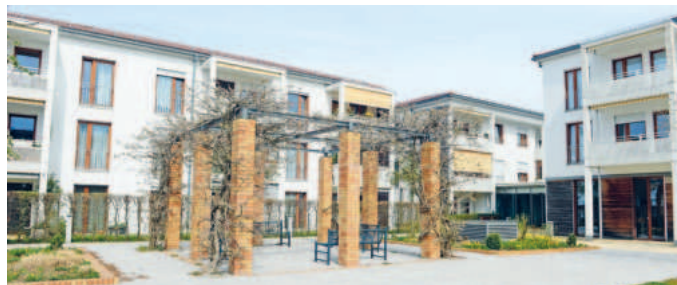
Im Seniorenzentrum steht auch eine Bank zum Austausch bereit.

7. und 21. Mai, 11. und 25. Juni, 9. und 23. Juli, 6. und 20. August, 3. und 17. September.