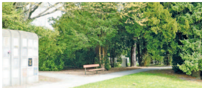
Das Ratschbankerl im Parkfriedhof.

Die Termine für die Bank im Parkfriedhof (1. Urnenfeld) am Dienstag um 17 Uhr sind: 5. und 19. Mai, 9. und 23. Juni, 7. und 21. Juli, 4. und 18. August sowie 1. September.