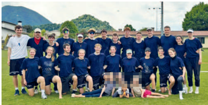
Das Mixed-Team von der Ultimate-Frisbee-Abteilung.

Trotz der knappen Niederlage zieht das Team ein positives Fazit. „Insgesamt bin ich mit der gezeigten Leistung sehr glücklich und traue dem Team noch deutlich mehr zu“, resümierte Coach Vincent Wagner. Die gezeigten Leistungen lassen optimistisch auf die kommenden Turniere und die weitere Vorbereitung auf die anstehende Weltmeisterschaft blicken.