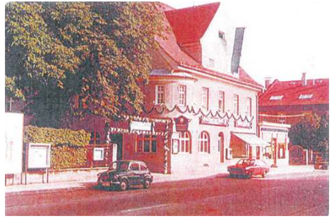
Gasthof zur Post im Jahre 1964.

terspiel und große Hochzeiten genutzt. Auch eine Außenkegelbahn trug zur Geselligkeit im damaligen Ortsleben bei.