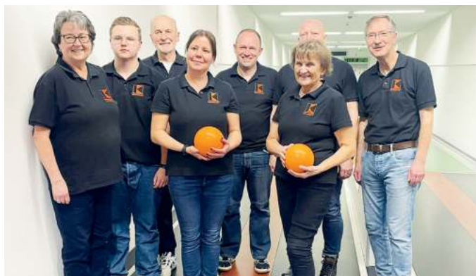
Die zwei Mannschaften der Unterföhringer Kolpingsfamilie.