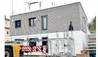
Im August sollen die Fertighäuser mit insgesamt acht Wohnungen bezugsfertig sein.