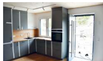
Die Küchen wurden bereits vollständig eingebaut.

Zwölf Wochen lang hatten mehr als 30 Mitarbeiter der Zimmerei Stark die Module in deren Produktionshalle in Auhausen angefertigt. Die vier Module für das erste Gebäude waren am Montag auf Schwerlasttransporter verladen und in der Nacht auf Dienstag in rund fünfständiger Fahrtzeit von Auhausen nach Unterföhring gebracht worden. Auch dank vereinzelter Straßensperrungen im Ort waren die vier 1,5-Zimmer-Wohnungen von jeweils rund 48 Quadratmeter Größe am Dienstagmorgen heil in der Isarau angekommen. Dort setzte ein Team von fünf Mitarbeitern der Zimmerei, drei Kranführern und drei Anlagenmechanikern für Sanitär-, Heizungs- und Klimatechnik die vier Wohnungen innerhalb von nur sieben Stunden zum ersten Gebäude des „Jungen Wohnens“ zusammen.