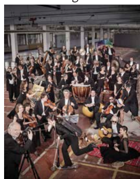
Die Nürnberger Symphoniker.