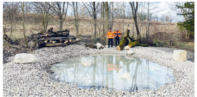
Eine Oase für Amphibien und Insekten haben Otto Fischer (r.) und Sven Fankhänel (l.) vom Bauhof entstehen lassen.

Ohne großen Aufwand und schnellentschlossen haben unsere Kollegen vom Bauhof, Otto Fischer und Sven Fankhänel, das alte Fundament des Container-Stellplatzes ausgebagert und mit Schotter eine Mulde geformt, die sich schon schnell mit Regenwasser gefüllt hat. Bis auf den Schotter und einzelne kleine Felsen mussten keine Materialien zugekauft werden. Vorhandenes Schnittgut wurde zu Totholzhaufen geschichtet und das Stammholz eines Baumes, der hatte gefällt werden müssen, gibt nun den Kleintieren ein neues Zuhause. Eine Begrünung des Biotops ist noch in Planung.