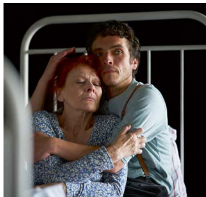
Henrik Ibsens Feenmärchen „Peer Gynt“ mit der Bühnenmusik von Edvard Grieg.

Am Samstag, 10. Februar um 20 Uhr führt das Münchner Ensemble Persona das dramatische Gedicht „Peer Gynt“ im Bürgerhaus auf. Das bekannteste Werk des norwegischen Dramatikers Henrik Ibsen basiert auf einem skandinavischen Feenmärchen und erzählt die Traumreise des Aufschneiders Peer Gynt.