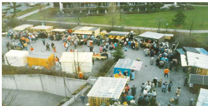
Blick vom Rathausdach auf den Christkindlmarkt von 1986.