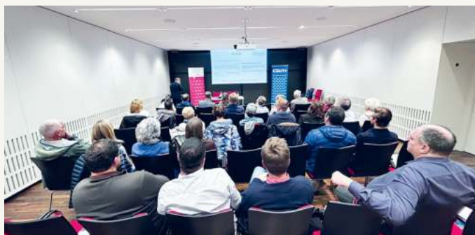
Vortrag im Kleinen Saal im Bürgerhaus.

Zu unserem Infovortrag „Erbrecht trifft jeden!“ am 12. November durften wir zahlreiche interessierte Gäste im Kleinen Saal im Bürgerhaus begrüßen. Es wurden Themen wie Testamentserstellung, der Pflichtanteil beim Erben und weitere schwierige Fragestellungen behandelt. Im Anschluss wurden bei der Frageunde noch Fragen der Besucherinnen und Besucher behandelt.