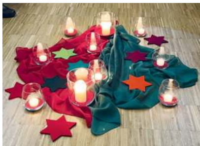
Die Frührschicht-Mitte. Gestaltet von Sigrun Sellmeier.

Advent - Warten auf Weihnachten - für eine halbe Stunde mit Gebet, besinnlichen Impulsen, Stille, Musik (meistens live) und Liedern den Tag beginnen. Wir laden herzlich alle Jugendlichen und Erwachsenen zur Frührschicht im Advent ein: am Freitag, 29. November, 6., 13. und 20. Dezember - jeweils morgens um 6 Uhr - im katholischen Pfarrzentrum am St.-Valentin-Weg 1.