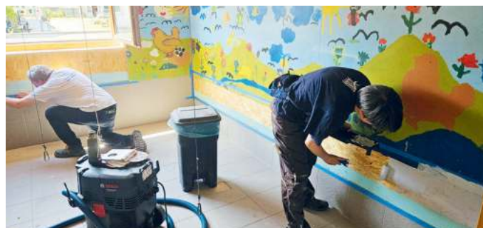
Die bislang letzte gemeinsame Arbeitsaktion: Renovierung des Hühnerstalls.

Viele Arbeitsaktionen unserer Vereinsgeschichte sind einigen von euch sicher noch in lebendiger Erinnerung. Vom Brunnenbau im Farmgarten über die „Sandbefüllung“ des Pferdebereichs bis hin zur letzten Aktion, bei der wir in gemeinsamer Tatkraft den Hühnerstall neu hergerichtet haben (siehe Foto). Bei diesen Arbeitsaktionen bringen die Mitglieder unseres Vereins die Idee der Farm zum Erlblühen.