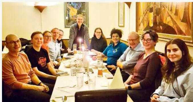
Austausch in gemütlicher Runde bei „Pizza & Politik“.

Im Jahr 2021 ist Unterföhring aufgrund unseres Antrags der Arbeitsgemeinschaft fahrradfreundlicher Kommunen in Bayern (AGFK) beigetreten. Die Gemeinde arbeitet seitdem an einem Radverkehrskonzept, um ihre Fahrradfreundlichkeit weiterzuentwickeln. Um Unterföhring radlfreundlicher zu gestalten, gilt es, Konflikte zwischen Radelnden und Zufußgehenden zu vermeiden, Schulwegsicherheit zu gewährleisten sowie Ampelschaltungen und die Führung an Baustellen zu verbessern. Außerdem müssen Radwege und -verbindungen geschaffen bzw. ausgebaut und hierzu Schulterschlüsse mit den Nachbarkommunen gesucht werden. Den Status quo wollen wir nicht akzeptieren und es wird Zeit, dass sich was ändert!