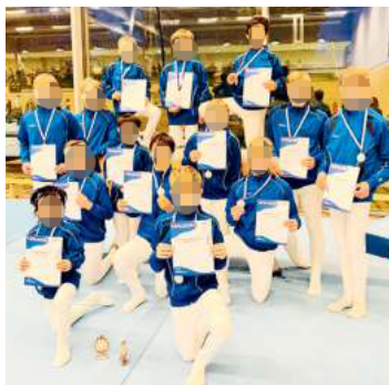
Die Turner holten sich die Qualifikation für den Regionalentscheid Oberbayern. Platz 1 für die C-Jugend und Platz 2 für die AB-Jugend.

Die Unterföhringer Mannschaften der C-Jugend und AB-Jugend qualifizierten sich schließlich weiter für den Regionalentscheid Oberbayern. Wir wünschen den Jungs im November viel Erfolg in Heufeld.