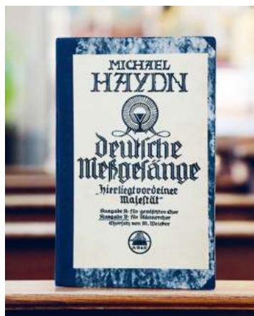
Die Haydn-Messe „Hier liegt vor deiner Majestät“.

Wir freuen uns auf Sonntag, 17. November , wenn wir in St. Valentin um 9 Uhr traditionell den Gottesdienst am Volkstrauertag musikalisch gestalten dürfen. Wir singen die sogenannte „Haydn-Messe“ von Michael Haydn, dem jüngeren Bruder von Joseph Haydn. Sie ist einer der seltenen deutschsprachigen Mess-Gesänge der Klassik, also nicht lateinisch, und vom Komponisten selbst als Hochamt „zum Gebrauch in Stadt und Land“ bezeichnet. Sie wurde von uns letztmals vor 6 Jahren in der Münchner Asamkirche gesungen, jetzt nach langer Zeit auch wieder in Unterföhring.