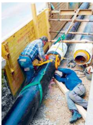
Leitungsbau an der Mitterfeldallee.

Geovol ist auch dieses Jahr mit viel Energie in Unterföhring aktiv und verlegt weiter neue Fernwärmeanschlüsse. Bis Ende des Jahres wird eine Anschlussleistung von rund 4,1 Megawatt neu unter Vertrag sein und damit die Anschlussleistung in Unterföhring auf insgesamt 75 Megawatt steigen. Gegenüber dem Wert von Ende 2023 ist das ein Zuwachs von knapp sechs Prozent. Ein großer Teil des diesjährigen Zuwachses geht auf die Allianz zurück, die ein weiteres Bürogebäude an das Geovol-Netz anschließt. Zuvor wurde das Gebäude von der SWM versorgt. Aber auch im Bereich der Privatanschlüsse gibt es nach wie vor Zuwachs - zum Beispiel am Lohwiesenberg, wo für die dort entstehenden Neubauten bereits elf neue Anschlüsse vereinbart sind. Stand jetzt sind rund 4.000 Haushalte, knapp 80 gewerbliche Abnehmer sowie 30 kommunale Immobilien an das Fernwärmenetz angeschlossen. Damit werden nun ungefähr 75 Prozent aller Gebäude in Unterföhring von der kommunalen Tiefengeothermieanlage beheizt.