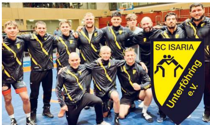
Die mitreißende Regionalligamannschaft.

Überraschung, Sensation oder schlicht das Glück des Tüchtigen? In jedem Fall dürfte der Auswärts-Sieg des SC Isaria gegen den SV Siegfried Hallbergmoos in die Vereinsgeschichte eingehen. Dank einer großartigen Leistung bezwang die „Erste“ der Unterföhringer den Absteiger aus der 2. Bundesliga am 7. Kampftag der Nike Regionalliga Bayern. Einen Sieg der Herren in Hallbergmoos hatte es seit Menschengedenken nicht gegeben. Entsprechend groß war die Freude der Isarianer, die im Laufe der Saison bislang zumindest etliche Rückschläge einstecken mussten.