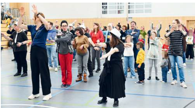
Gemeinsam tanzen und Spaß haben beim „Tag für alle“.

Bei herbstlichem Sonnenschein stand Unterföhring am 27. Oktober ganz im Zeichen von Vielfalt und Inklusion. In der Jugendfreizeitstätte Fezi und im Sportzentrum begegnete sich am ersten Inklusionstag der Gemeinde, dem „Tag für alle“, eine Vielzahl von Gästen und Mitwirkenden. So bunt wie die Herbstblätter waren das Programm und Angebot, so strahlend wie der Sonntag die Gesichter. Für jede und jeden war etwas dabei, Höhepunkt war am Nachmittag die erstmalige Verleihung des Unterföhringer Inklusionspreises.