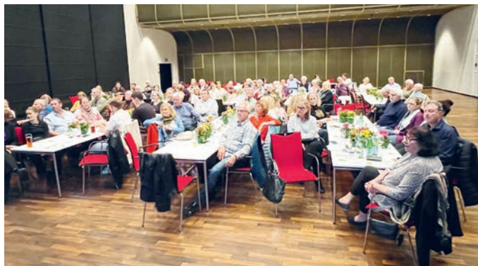
Die Mitglieder im gut gefüllten Bürgerhaussaal.