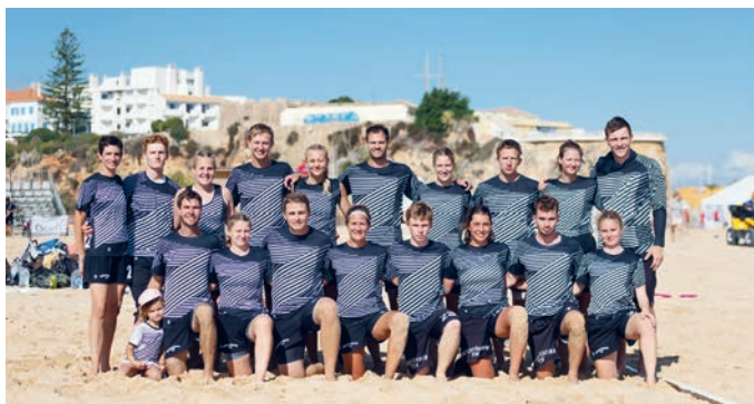
Die Unterföhringer Zamperl bei den Beach-Weltmeisterschaften in Portugal.

Für die Frisbee-Abteilung des TSV Unterföhring war es das absolute Saisonhighlight: als amtierender deutscher Meister durften die Zamperl zur Weltmeisterschaft im Beach Ultimate Frisbee nach Portimao/Portugal reisen. Insgesamt gab es in den Divisionen Herren (40 Teams), Frauen (20 Teams) und Mixed (54 Teams) weit über 100 Mannschaften aus 30 Nationen, die zu diesen erstmal stattfindenden Weltmeisterschaften angereist waren.