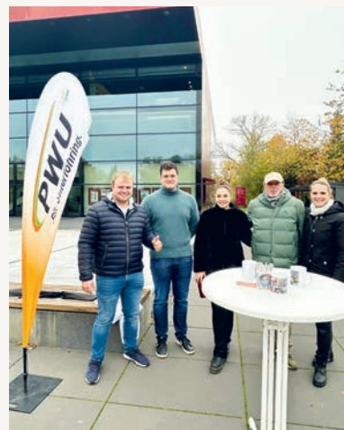
PWU-Infostand am Wochenmarkt.

Zahlreiche Bürgerinnen und Bürger kamen am vergangenen Samstag dem Aufruf nach, sich persönlich mit den PWU-Gemeinderätinnen und Gemeinderäten am Infostand auf dem Wochenmarkt über das aktuelle Ortsgeschehen zu informieren.