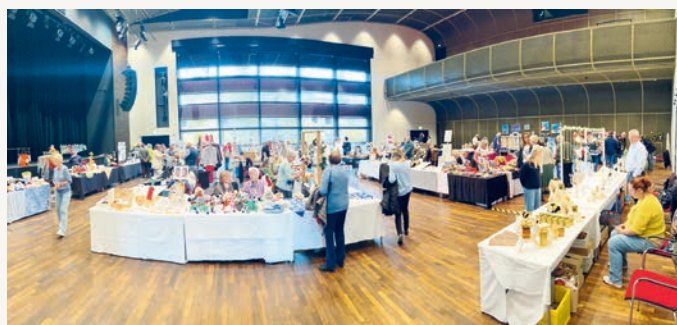
CSU Unterföhring „kurz vor der offiziellen Eröffnung“.