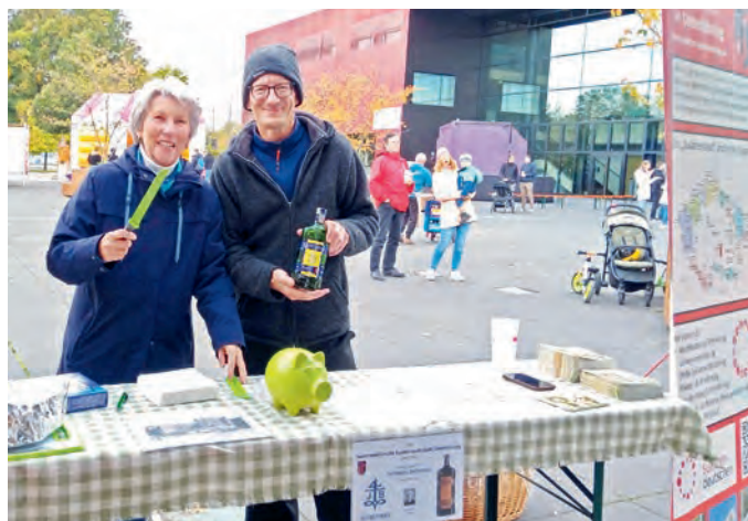
Das Standteam vor dem Bürgerhaus.

Am Bürger-Kulturfestival beteiligte sich die Ortsgruppe der Sudetendeutschen Landsmannschaft mit einem Stand, an dem wir für die Besucher Karlsbader Becherovka ausgeschenkt haben. Für die Kinder hatten wir Oblaten aus Marienbad und kleine Bücher über die alte Heimat dabei. Unser Mut, auf eine Hütte zu verzichten und uns unter freiem Himmel zu präsentieren, wurde vom Wetter belohnt.