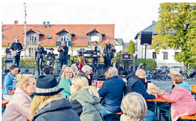
„Back to the 80s“ spielten am Samstagnachmittag vor dem Bürgerhaus.