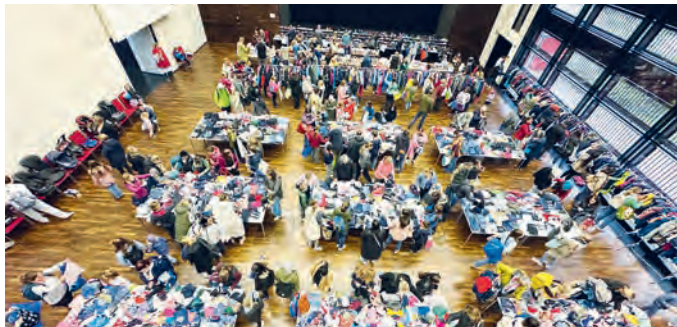
Reichhaltiges Angebot beim Kinderkleiderbasar.

etwa 400 Interessenten und Kauflustige fanden ihre Schnäppchen unter den mehr als 7.200 Artikeln, die 210 Verkaufende zuvor abgegeben hatten.