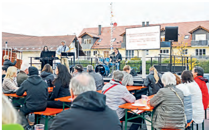
Unterföhring sang beim für alle offenen Mitsingkonzert.

Am Samstagabend dann feierte das Stück „Splitter Heimat“ seine Uraufführung. Die 18 Mitwirkenden von 8 bis über 80 Jahren hatten sich im April 2024 zu dem gemeinschaftlichen Tanzprojekt angemeldet und in den folgenden Monaten unter der professionellen Leitung des Münchner Choreografen Josef Eder und seines Teams ihr zeitgenössisches Tanztheaterstück erarbeitet. Bei diesem spannenden Probenprozess standen nicht nur das gemeinsame Tanzen und die Freude an der Bewegung im Mittelpunkt, sondern vor allem auch die Möglichkeit voneinander zu lernen, aufeinander zu vertrauen und sich gemeinschaftlich auszudrücken.