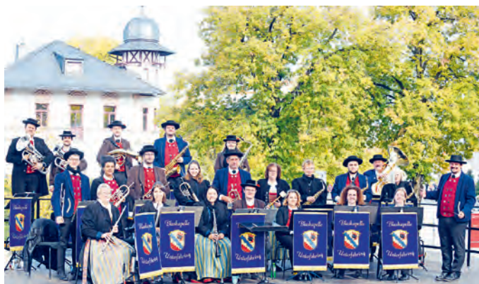
Die Blaskapelle eröffnete das Open-Air-Festival am Samstag.