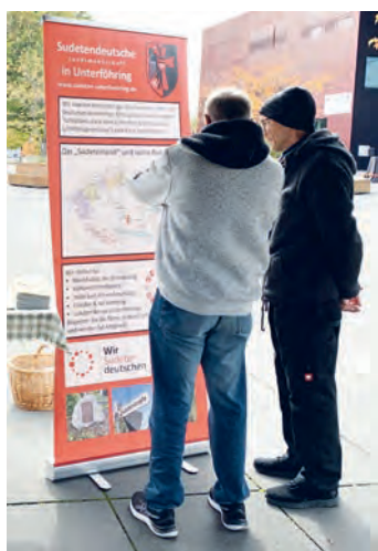
Angeregte Gespräche vor der Karte des Sudetenlandes.

Am Bürger-Kulturfestival beteiligte sich die Ortsgruppe der Sudetendeutschen Landsmannschaft mit einem Stand, an dem wir für die Besucher Karlsbader Becherovka ausgeschenkt haben. Für die Kinder hatten wir Oblaten aus Marienbad und kleine Bücher über die alte Heimat dabei. Unser Mut, auf eine Hütte zu verzichten und uns unter freiem Himmel zu präsentieren, wurde vom Wetter belohnt.