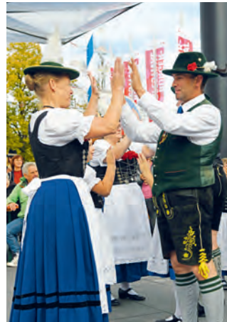
Der Trachtenverein Unterföhring zeigte Volkstänze.

Die Gäste erlebten nicht nur einen magischen, hochprofessionellen Tanzabend voller poetischer Bilder, Geschichten und anmutiger Bewegung, sondern spürten auch die Kraft, die die zusammengewachsene Gruppe auf der Bürgerhaus-Bühne entfaltete. Am Ende gab es donnernden Applaus und eine sichtlich bewegte Tanz-Community – am Samstagabend ebenso wie bei der zweiten Aufführung am Sonntag.