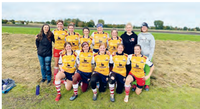
Die Fairy-Boars wachsen immer mehr als Team zusammen.

Am vergangenen Samstag traten die Unterföhringer Damen bei ihrem ersten Heimturnier seit zwei Jahren an. Bei herrlichem Wetter spielten sie als SG „die Fairy-Boars“ gegen den Titelverteidiger Innsbruck sowie in zwei spannenden Derbys gegen die Münchner Teams Studentenstadt und MRFC. Man konnte deutlich sehen, dass die Spielgemeinschaft mit Regensburg immer besser als Team funktioniert – das spiegelte sich auch in den Ergebnissen wider. Auch wenn es am Ende nicht zum Sieg reichte, wurden die gesetzten Ziele erfolgreich umgesetzt. Im Anschluss ließen die Spielerinnen den Tag gemeinsam mit den Kolleginnen aus den anderen Mannschaften gemütlich ausklingen – ein großes Lob und ein dickes Dankeschön an dieser Stelle noch mal an alle, die sich an der Organisation beteiligt haben. Die Fairy-Boars freuen sich schon auf den Herbstpokal am 27. Oktober in Nürnberg.