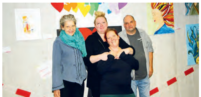
Die Rückmeldung auf die feringART hat die Mitglieder der Kunst Community.UFG sehr erfreut.

Beim Bürger-Kulturfestival am Samstag waren wir mit einem Kreativstand für Kinder vor Ort. Die Kinder haben mit Begeisterung Steine angemalt und Origamikunstwerke gefaltet.