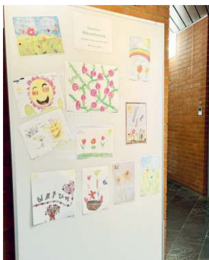
Im Foyer des Rathauses können die Blumenbilder aller drei Alterskategorien (im Bild Altersgruppe 5 bis 12 Jahre) noch bis zum 1. Oktober bestaunt werden.

So viele wunderschöne Bilder zu unserem Sommer-Malwettbewerb zur Landesgartenschau in Kirchheim 2024 wurden eingereicht. Die Auswahl fiel unserer Jury nicht leicht, doch die Gewinnerinnen und Gewinner der drei Altersgruppen stehen fest und wurden bereits persönlich von uns informiert.