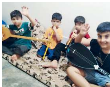
Die Kinder im Flüchtlingslager Daraschikran freuen sich über die Spende der Musikinstrumente.

Dank unseres Helfers Raed vor Ort im Nord-Irak konnten wir es ermöglichen, zahlreiche Musikinstrumente für die Kinder in den Flüchtlingslagern in Daraschikran und in Kawrgosk einzukaufen. Darunter sind Blockflöten und verschiedene Saiteninstrumente, auf denen die Kinder lernen zu musizieren.