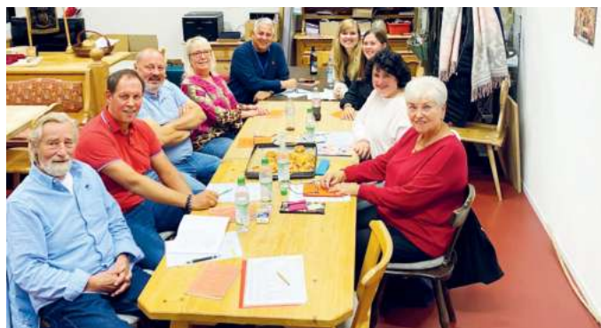
Die Laienspielgruppe probt schon fleißig für das Herbst-Theaterstück „Mucks Mäuserl Mord“.

Liebe Vereinsmitglieder, liebe Theaterfreunde, es ist wieder soweit! Unser Herbst-Theaterstück steht fest: „Mucks Mäuserl Mord“ von Ralph Wallner – ein spannendes und unterhaltsames Stück, das garantiert für viele Lacher sorgt.