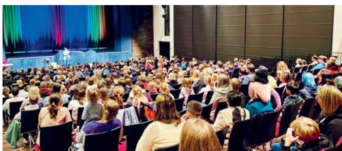
Der Bürgersaal brummte.

In diesem Jahr haben 243 Kinder und Jugendliche mit großer Begeisterung am jährlichen Sommerferien-Leseclub der Bibliothek teilgenommen und dabei über 2.500 Bücher gelesen und bewertet.