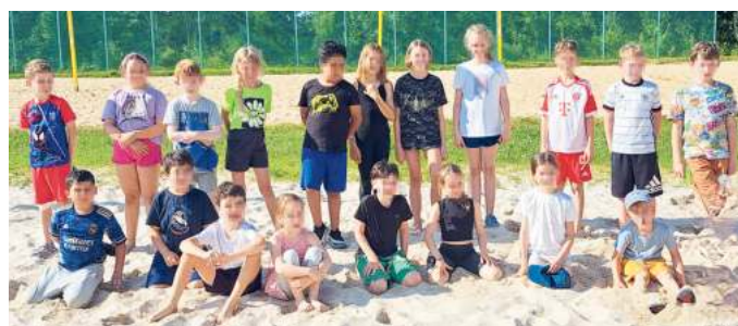
Gruppe Sport & Spiel.

Nach schönen sportlichen Ferien treffen wir uns seit Schulbeginn wieder in der Dreifachhalle.