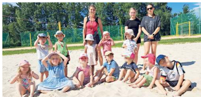
Gruppe Kleinkinder-Turnen.