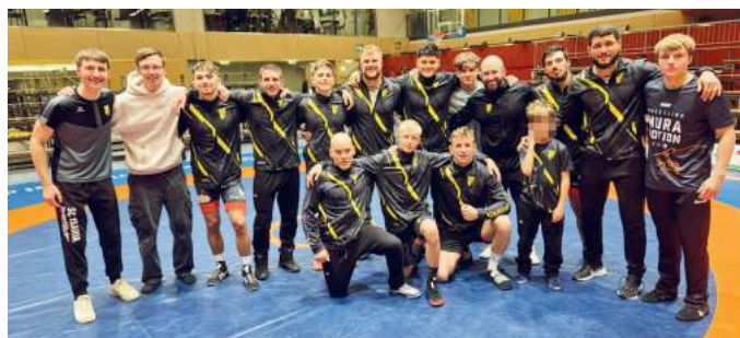
Die erfolgreiche Männermannschaft.

Am vergangenen Samstag begann für den SC Isaria die neue Saison – und das gleich mit spannenden Begegnungen auf allen Ebenen. Den Auftakt machte die 2. Schülermannschaft gegen den AC Penzberg. Trotz einer Niederlage mit 21:40 konnte die blutjunge Mannschaft vielversprechende Ansätze zeigen und deutete auf eine vielversprechende Zukunft hin.