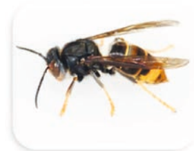
Asiatische Hornisse.

Bitte melden Sie Sichtungen von Asiatischen Hornissen (Einzeltiere oder Nester) an die folgende Adresse: Institut für Bienenkunde und Imkerei, Bayerische Landesanstalt für Weinbau und Gartenbau (LWG), An der Steige 15, 97209 Veitshöchheim, Tel. 0931 / 9801-3600, oder per E-Mail an ibi@lwg.bayern.de .