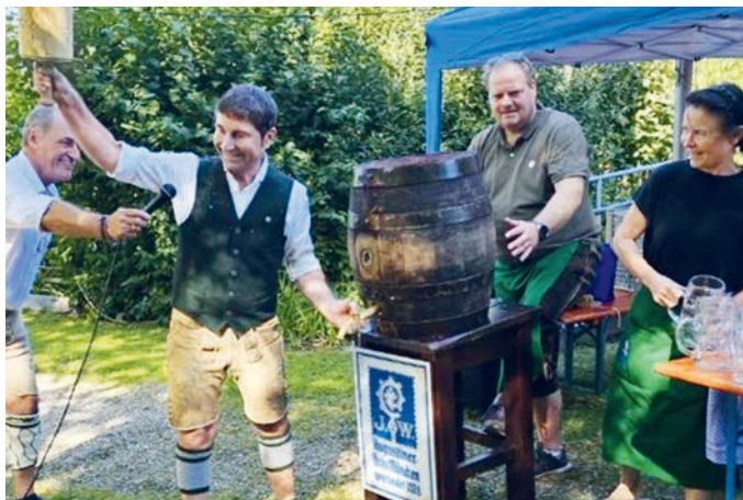
Wiesnanstich 2023 im Kleingartenverein.

Feiern Sie mit uns! Alle Gartenfreunde und Unterföhringer Bürgerinnen und Bürger sind herzlich eingeladen am Samstag, 21. September um 11.45 Uhr im Festzelt in der Kleingartenanlage den Wiesnanstich zu feiern. Um 12 Uhr wird durch unseren Bürgermeister Andreas Kemmelmeyer o`zapft. Zum süffigen Augustiner Wiesnbier gibt es neben Hendl, Hax'n und Steckerlfisch auch Wiesn-Brezn, Fischsemmeln sowie am Nachmittag ein großes Kuchenbuffet und Kaffee. Das Kinderprogramm ist von 13 bis 15 Uhr auf der großen Wiese.