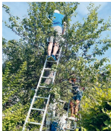
Fleißige Helfer beim Ernten an der Gartenstraße.

Vor Kurzem wandte sich Deborah Rohm vom Bauamt der Gemeinde an uns und fragte, ob unser Gartenbauverein die reifen Früchte von den Obstbäumen auf den Gemeindegrundstücken ernten könnte, bevor sie verderben.