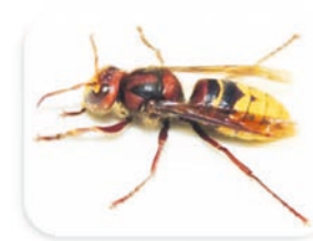
Europäische Hornisse.

Glücklicherweise lassen sich die beiden Arten durch eine Reihe von spezifischen Merkmalen sehr gut unterscheiden. Die Asiatische Hornisse hat beispielsweise eine schwarze Grundfärbung und einen breiten orangenen Streifen am Hinterleib sowie eine feine gelbe Binde am ersten Segment. Weitere Merkmale und Informationen können Sie online, www.unterfoehring.de , bei den News aus Unterföhring entnehmen.