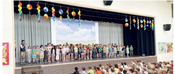
Die Siegerklassen der Grundschule Unterföhring.

ausgelöst. Sämtliche fast 500 Schülerinnen und Schüler hatten an dem Wettbewerb teilgenommen, bei dem es darum ging, in drei Wochen den Schulweg möglichst umweltfreundlich zurückzulegen – also zu Fuß, mit dem Roller, dem Fahrrad oder den öffentlichen Verkehrsmitteln. Die Kinder, die zwischen dem 10. und 28. Juni ihren Schulweg auf klimaverträgliche Weise bewältigten, sammelten Punkte für das Klassenkonto. In der Aula der Grundschule wurden nun die Klassen pro Jahrgang geehrt, die bei der Punktejagd am erfolgreichsten waren.