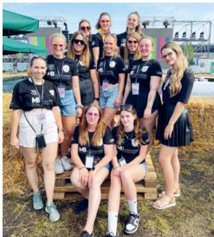
Der Deandlverein war beim „Summer of Sin“ zahlreich vertreten.

Gästen sowie auch uns die Stimmung nicht vermiesen können. Und so feierten wir gemeinsam bis in die Nacht. Wir haben uns riesig gefreut, dass wir unsere Burschen unterstützen und vor Ort helfen konnten und sind auch bei der nächsten Veranstaltung gerne wieder mit helfenden Händen dabei!