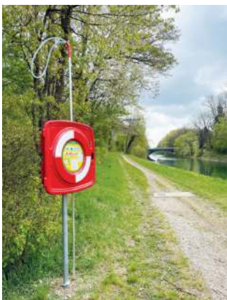
So sieht eine der Rettungsstationen am Isarkanal in funktionstüchtigem Zustand aus.

Zehn Rettungsstationen hat die Gemeinde Unterföhring entlang des Isarkanal installiert. Aus gutem Grund, wie sich zum Beispiel im Dezember 2022 zeigte, als eine Frau bei der Rettung ihres Hundes in den eiskalten Kanal gerutscht ist. Aus eigener Kraft wäre sie, stark unterkühlt, nicht wieder