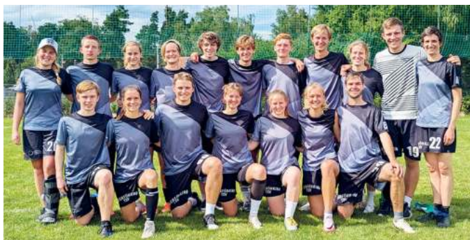
Glücksgefühle in Nürnberg: Die Zamperl sind überraschend Deutscher Vizemeister.

Am Wochenende 13./14. Juli starteten die Zamperl mit ihrem Mixed-Team zum zweiten Wochenende der Deutschen Meisterschaften im Ultimate Frisbee auf Rasen in Nürnberg. Am ersten Wochenende war die Bilanz leicht positiv ausgefallen: drei Siege bei zwei Niederlagen, eine gute Ausgangsposition für das ausgerufene Saisonziel Klassenerhalt. Hierzu sollte ein Sieg am zweiten Wochenende ausreichen. Nach einer knappen Auftaktniederlage gegen den Mitfavoriten Freiburg (13:15) machten die Zamperl das Minimalziel mit einem 15:8 gegen Tübingen klar.