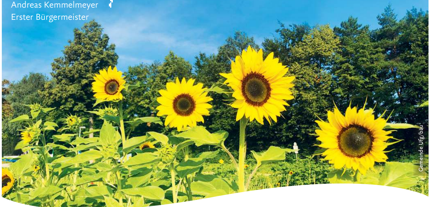
Andreas Kemmelmeyer Erster Bürgermeister