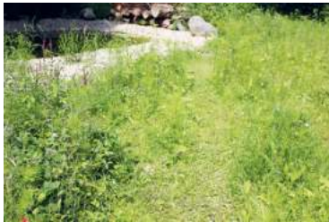
Vorher-Nachher: Die kleine Oase an der Birkenhofstraße erblüht für die wilde Kleintierwelt.

Aus gegebenem Anlass bitten wir erneut darum, diesen geschützten Raum für die Tiere als solchen zu respektieren, nicht in das Biotop hineinlaufen und keinen Müll zu hinterlassen. Gerne dürfen Sie auf dem zur Abtrennung hingelegten Baumstamm Platz nehmen, um die Natur zu beobachten.