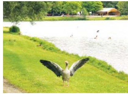
Die Wildgänse sind einigen Badegästen am Feringasee ein Dorn im Auge.

In den vergangenen Wochen sind wieder vereinzelt Beschwerden eingegangen, dass eine Vielzahl an Wildgänsen den Bade- genuss im FKK-Bereich am Feringasee mit ihrer Hinterlassenschaft beeinträchtigt. Der zuständige Landkreis München zieht daraus nun Konsequenzen. So wird fortan praktisch über die gesamte Badesaison hinweg bei jedem Mähdurchgang nicht nur das geschnittene Gras von der FKK-Halbinsel abgefahren, sondern auch der angefallene Gänsekot. Das sollte die Situation deutlich verbessern. Das Landratsamt appelliert darüber hinaus an die Badegäste, die Gänse nicht zu füttern. Das auch durch mehrere Schilder deutlich sichtbare Verbot werde leider von einigen Badegästen ignoriert. Das habe zur Folge, dass die Gänse jede Scheu gegenüber den Menschen verlieren und direkt um Futter betteln. Darüber hinaus wirbt der Landkreis um ein gewisses Maß an Verständnis dafür, dass wildlebende Tiere zwangsläufig Teil eines Erholungsgebiets in freier Natur sind.