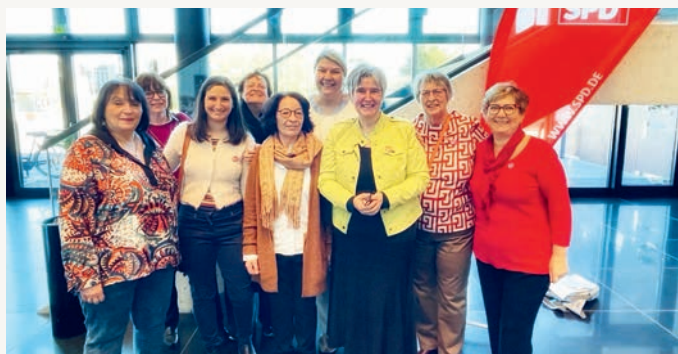
Die SPD-Frauen trafen sich zum Frühstück im Bürgerhaus.