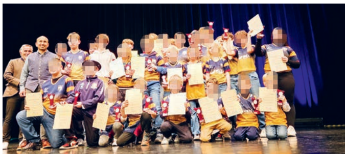
Die Rugby-Jugend.

Am 1. März fand die Sportlerehrung 2024 der Gemeinde im Bürgerhaus statt (siehe Seite 1). Auch der RCU war stark vertreten. Das Jahr 2023 war für die Jugend und die Herren gleichermaßen erfolgreich. Die U8 und die U12 erreichten den ersten Platz bei den Bayerischen Meisterschaften, die U14 den zweiten und die U10 den dritten Platz. Die U16, als Teil einer Spielgemeinschaft, wurde Dritter in der Deutschen Rugby Jugendliga und belegte den fünften Platz bei der Deutschen Meisterschaft. Die Herren sicherten sich den Vizemeistertitel in der 2. Bundesliga Süd. Diese Bilanz, elf Jahre nach Gründung unseres Vereins, kann sich sehen lassen.