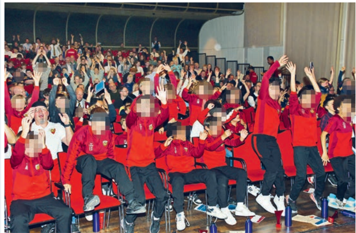
Super Stimmung im Saal des Bürgerhauses mit den jungen Fußballern.