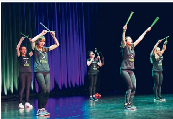
Den ersten Showact des Abends lieferte die Pound-Fitness-Gruppe des TSV.