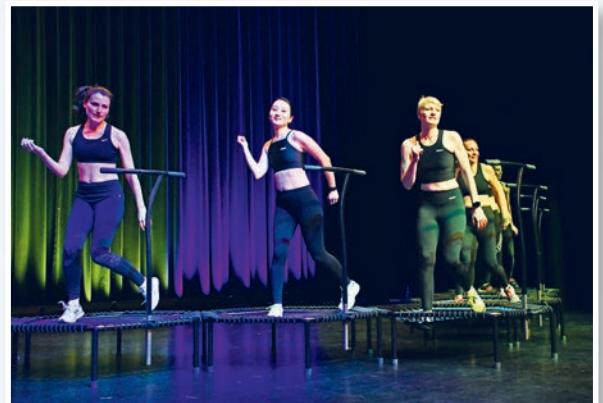
Bei Jumping Fitness braucht es Ausdauer auf dem Trampolin.