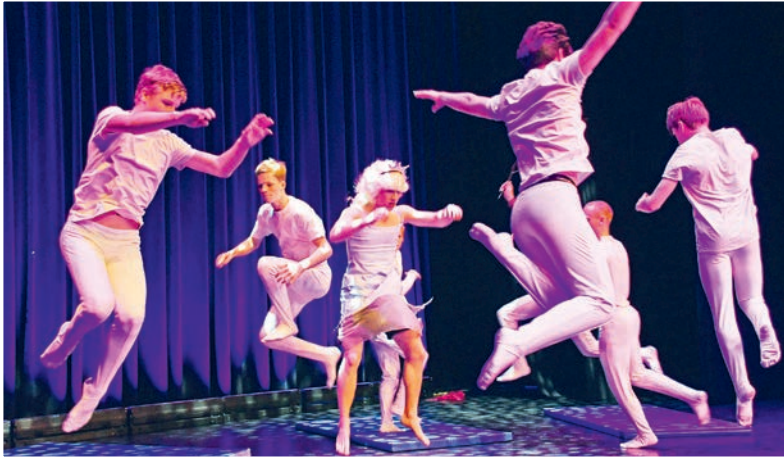
Mit Humor brachten die Bundesliga-Turner Elsa aus der Eiskönigin auf die Bühne.