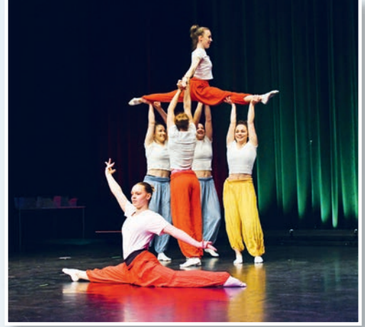
Die Bundesliga-Turnerinnen des TSV zeigten einen Ausschnitt aus ihrem Programm beim jüngsten Nikolausturnen zur Musik des Disneyfilms Aladin.