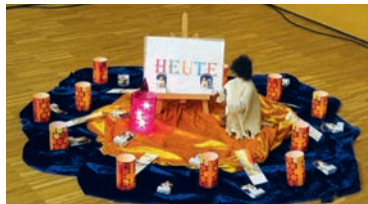
Frühschicht im katholischen Pfarrzentrum.

Advent - Warten auf Weihnachten - für eine halbe Stunde mit Gebet, besinnlichen Impulsen, Stille, Musik und Liedern laden wir herzlich alle Jugendlichen und Erwachsenen jeweils am Freitagmorgen, 1., 8. und 15. Dezember , um 6 Uhr zur Frühschicht im Advent im katholischen Pfarrzentrum am St.-Valentin-Weg 1 ein.