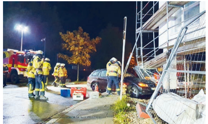
Das Gerüst wurde mit Baustützen gesichert.

Am Abend des vergangenen Samstags wurden die Freiwillige Feuerwehr und das THW München Land zum Absichern eines Baugerüsts an der Apianstraße alarmiert. Ein PKW war durch einen Bauzaun gefahren und mit dem Gerüst des neuen Studentenwohnheimes kollidiert. Glücklicherweise blieben Fahrer und Insassen unverletzt. Durch die Kollision wurde das Gerüst des fünfgeschossigen Neubaus instabil und drohte einzustürzen. Der Verkehr musste deshalb großräumig umgeleitet werden.