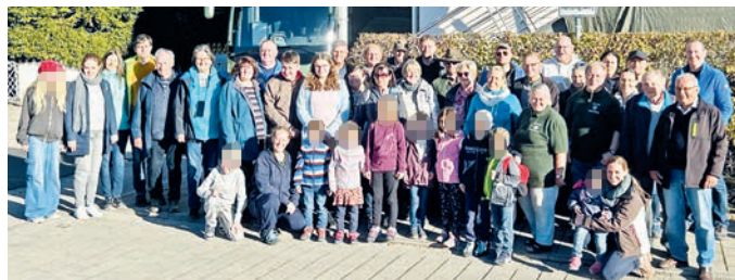
Die Vereinsmitglieder mit ihren Familien.

Am 22. Oktober startete eine Gruppe unserer Vereinsmitglieder und der Jugendgruppe mit Familien zu unserem diesjährigen Vereinsausflug zum Schliersee. Pünktlich fuhren wir mit unserem Bus zum Freilichtmuseum Markus Wasmeier. Dort konnten wir nicht nur die alten Höfe in der schönen Voralpenlandschaft anschauen. Es gab auch besondere Stationen für die Jugend zum Thema „Spielen wie vor 100 Jahren“ mit Seilspringen, Ball an die Wand, Reifen treiben, Kegeln, verschiedenen Wurfspielen und vielem mehr. Am Ende konnten sich die fleißigen Kinder, die alle Stationen besucht hatten, eine kleine Wundertüte mit Süßigkeiten, Voglpfeiferl und Murmeln abholen. So ging der Vormittag schnell vorbei.