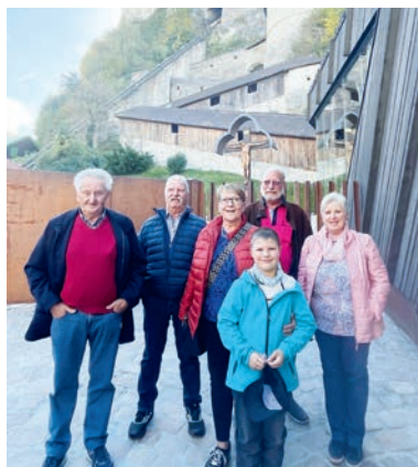
Man konnte es kaum erwarten, die Fahrt nach oben anzutreten.

Am 21. Oktober fand der traditionelle AWO-Ausflug statt. Diesmal ging es ins wunderschöne Kufstein und das Wetter hätte besser nicht sein können. Erste Station war die über Generationen hinweg bestehende Tiroler Glashütte Riedel. Im Museum konnten die Besucher einen interessanten Einblick von der Glaskunst und -herstellung gewinnen. Im angeschlossenen Shop konnte nach Herzenslust eingekauft werden, bevor es zum Mittagessen ins ebenfalls berühmte Auracher Löchl ging, die Wiege des weltberühmten Kufsteinlieds. Gut gestärkt erkundete ein Teil der Gruppe Kufstein nun auf eigene Faust, während die anderen sich die Festung nicht entgehen ließen. Das über 800 Jahre alte Bauwerk hatte so einiges zu erzählen. Besonders die Folterkammern hinterließen einen bleibenden Eindruck und sorgten für Gesprächsstoff.