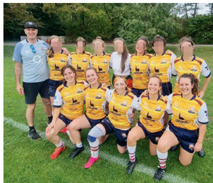
Die Frauen der Spielgemeinschaft Süd schlugen sich beim zweiten Turniertag wacker.

Süd gegen Innsbruck 7:20. Im zweiten Spiel trat sie gegen ein starkes Team aus Fürstenfeldbruck (FFB) an. Die gut eingespielte Mannschaft kämpfte sich Meter für Meter vorwärts und schaffte es, über Offloads und schnelles Spiel über die Außenseite die Lücken in der Verteidigung zu finden. Der Endstand von 38:0 zeigte deutlich die Stärke von FFB, das sich erst im Finale der SG Nürnberg/Würzburg geschlagen geben musste. Im letzten Spiel gegen den Ausrichter holte die SG Süd deutlich auf. Die Kommunikation passte, die Pässe erreichten schnell die Mitspielerin und die Verteidigungslinie ließ kaum Gegnerinnen durch. Mit einem 36:10 verwies die SG Süd den Ausrichter MRFC klar auf den letzten Platz. Der dritte Spieltag findet bereits in einer Woche in Bad Reichenhall statt.