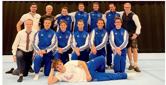
Unsere Turner beim Bundesligawettkampf.

Auch im zweiten Bundesligawettkampf gegen die TSG Backnang haben sich die Jungs des TSV einen Sieg gesichert. Dieses Mal mit einem Endstand von 59:10-Scorepunkten auch deutlicher als in der Vorwoche gegen den USC München (30:28). Geschichte geschrieben wurde vor allem am Pauschenpferd - vier sturzfreie Übungen und der Gerätesieg mit 14:0 Punkten - das gab es in Unterföhrings Bundesligahistorie noch nie! An den anderen Geräten konnte man ebenfalls mit geschlossener Teamleistung überzeugen.