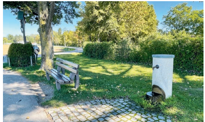
Der Radlbrunnen an der Ecke Aschheimer Straße/Etweg bleibt ohne schmückenden Aufsatz.

Im Zuge der Bundesgartenschau 2005 im neuen Landschaftspark Riem war rund um München die Fahrradstrecke „Münchener Radring“ entworfen worden. Auf dieser Strecke hatte es damals vier neue Trinkwasserbrunnen gegeben. Diese Radlbrunnen in Haar, Krailling, Unterschleißheim und Unterföhring zierte jeweils ein Werk der Bildhauerin Johanna Körner. Im vergangenen Juni hatten Unbekannte nun die kupferne Radl-Skulptur auf dem Unterföhringer Brunnen an der Ecke Aschheimer Straße/Etweg abgesägt und gestohlen.