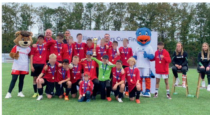
Die U14 des FCU gewann den Allianz Juniors Cup beim FC Bayern Campus.

Vereinsheim ausklingen lassen. Wir freuen uns auf viele Unterföhringer an der Bergstraße.