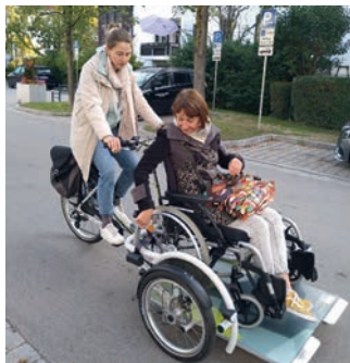
Das Team des Beratungszentrums ließ es sich nicht nehmen, das neue inklusive Gefährt auszuprobieren.

In Kooperation mit der Gemeinde konnte die Nachbarschaftshilfe mit Förderung von Aktion Mensch ein E-Rollstuhlfahrrad anschaffen, das für alle Unterföhrringerinnen und Unterföhrringer zum Ausleihen zur Verfügung steht.