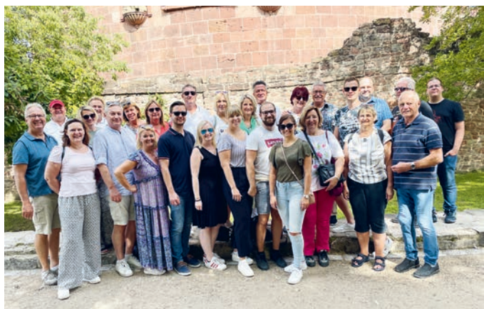
Die Ausflugsteilnehmer beim Schloss Heidelberg.

Am 1. September war es endlich wieder soweit: Vereinsausflug ins Rheingau und nach Heidelberg. Pünktlich um 9 Uhr starteten wir in Richtung Worms mit unserem altbewährten Kistler Busfahrer Fonsi. Auf halber Strecke gab's a zünftige Brotzeit mit Würstln, Brezn, Bier, Prosecco und Schnaps. Kaum im Hotel in Worms eing_checked ging's schon weiter zum Weingut Spohr, wo unser Fred beim Winzer einen Sektempfang in den Weinbergen mit anschließender Kellereibesichtigung und Weinverkostung mit Brotzeit organisiert hatte. Ein wirklich gelungener, schmackhafter Abend!