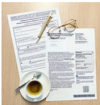
Informieren Sie sich jetzt über die Landtagswahl am 8. Oktober 2023.