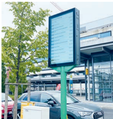
Diese große Anzeigetafel steht nun vor dem S-Bahnhof.

Auch am S-Bahnhof Unterföhring wurde nun auf dem Grün zwischen VHS und Bahnhofsgebäude eine große Tafel installiert, auf der die Abfahrtszeiten sämtlicher Verkehrsmittel von dort zu sehen sind. Im Juni schon waren die Wartehäuschen der am meisten frequentierten Bushaltestellen in Unterföhring mit diesen so genannten DFI-Anzeigern ausgerüstet worden. An allen Standorten gibt es einen so genannten Text-to-Speech-Taster. Drücken Sie die Taste, werden die auf der Tafel zu sehenden Informationen dem Fahrgast vorgelesen.