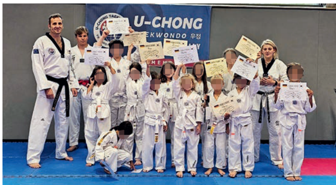
Für alle Prüflinge ist die neue Graduierung eine wohlverdiente Aus-

vor Aufregung, als sie sich bereit machten, ihre erlernten Fähigkeiten unter Beweis zu stellen. Die Spannung stieg, als die Prüfer die Anweisungen gaben und die Kinder ihre verschiedenen Techniken, Kicks und Blocks zeigten. Mit Eifer und Konzentration kämpften sie sich durch die Prüfung.