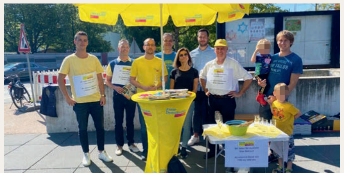
Der FDP-Infostand 2021.

In den kommenden Wochen macht das Gemeindeblatt Unterföhring wohlverdiente Sommerpause. Die FDP wird in dieser Zeit aber weiterhin für die Unterföhringer:innen präsent bleiben. Der Ortsverband steht für Sie bereit, um an Infoständen Ihre Fragen zu beantworten. Unser erster Termin wird am Samstag, 9. September sein. Weitere Termine sind jeweils samstags am 16., 23. und 30. September sowie am 7. Oktober. Die Stände finden immer von 8.30 bis 13 Uhr auf dem Unterföhringer Wochenmarkt statt.