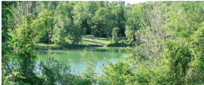
Poschinger Weiher.

Im August finden keine regulären Sprechstunden des Seniorenbeirats statt. Aber wir sind unabhängig davon natürlich wie immer telefonisch oder per E-Mail für Sie erreichbar.