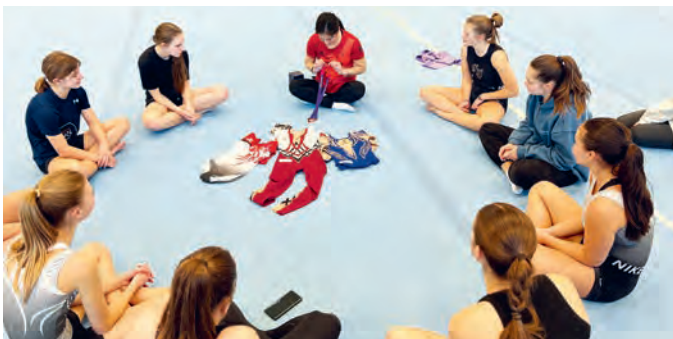
Turnerin Kim Bui mit den Turnerinnen des TSV.

Die renommierte Turnerin Kim Bui besuchte den TSV und sorgte für Begeisterung in der Turnhalle. An einem Wochenende im Januar bot sie den Athletinnen der Turnabteilung exklusive Trainingseinheiten an. Kim Bui übernahm das Aufwärmen und ging individuell auf die Wünsche der Mädchen und Trainer:innen ein. Insgesamt 16 Stunden lang teilte sie ihr umfangreiches Wissen und ihre Techniken mit den Turnerinnen. Dabei konzentrierte sie sich auf verschiedene Aspekte wie Lauftraining, das Slider-Programm, Kraft-Zirkel und grundlegende Übungen. Die Turnerinnen nahmen die Tipps und Übungen dankbar an und setzen das Gelernte im regelmäßigen Training um.