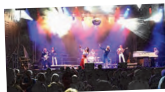
ABBA rockte Unterföhring nicht nur musikalisch, sondern auch mit einer tollen Licht-Show am Abend.