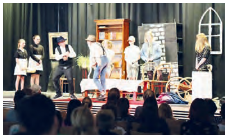
Die Schüler:innen der Jahrgangsstufen 6 und 7 erlösten das Gespenst von Canterville von seinem Fluch.

Voller Energie, Spielfreude und mit viel Gefühl für die komischen, aber auch die nachdenklich stimmenden Momente des Theaterklassikers „Das Gespenst von Canterville“ von Oscar Wilde agierten die jungen Schauspielerinnen und Schauspieler am 28. Juni in der Aula des Unterföhringer Gymnasiums.