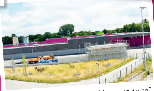
Blick aus nördlicher Richtung auf den neuen Bauhof.