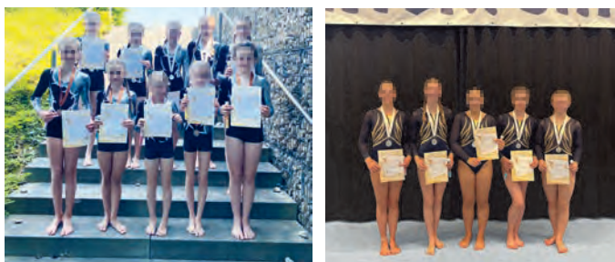
Die C-Jugend (links) und die A/B-Jugend (rechts) beim Bayern-Pokal in Unterföhring.

Auch die Jugend A/B des TSV Unterföhring konnte Erfolge verbuchen. In der 1. Liga erreichte sie den fünften Platz und qualifizierte sich somit ebenfalls für das Finale im Herbst. Trotz kurzfristiger Ausfälle konnte sie in der 3. Liga antreten, jedoch nur zu zweit, und belegte den achten Platz.