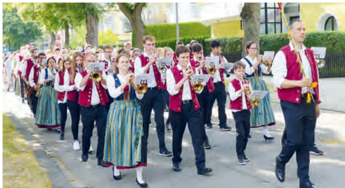
Festzug der Blaskapelle zum Feuerwehrjubiläum.

Nachdem die Blaskapelle bereits am Fronleichnamfest, beim Traditionsabend im Bürgerhaus für die neuseeländische Delegation der „Special Olympics“ sowie bei der Eröffnung des Bürgerfestes und beim 150-jährigen Feuerwehr-Jubiläum mit Festgottesdienst und Festzug durch den Ort musikalisch stark im Einsatz war, dürfen die Freunde der Blasmusik einen weiteren Auftritt der Blaskapelle erwarten.