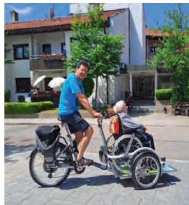
Das neue E-Rollstuhlfahrrad bringt Freiheit und Teilhabe in unsere Gemeinde.