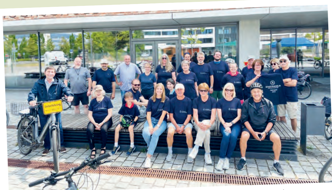
Die Unterföhringer Radlergruppe vor Beginn der Ortsrundfahrt mit dem Bürgermeister.