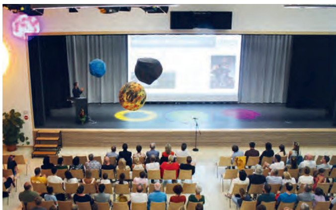
Die künstlerischen Astronomie-Werke der Schüler:innen schmückten den Vortragsabend in der Aula.

Schülerinnen und Schüler, Eltern, Lehrkräfte sowie interessierte Bürgerinnen und Bürger versammelten sich am 22. Juni zu einem Abend voller faszinierender Vorträge, Präsentationen und künstlerischer Exponate, um die Geheimnisse des Universums zu erkunden. Schon beim Betreten der Aula konnten die Gäste den künstlerischen Aspekt der Astronomie bestaunen. Zahlreiche Exponate aus dem Kunstunterricht sorgten für Staunen und Bewunderung, die die Schülerinnen und Schüler aus verschiedenen Jahrgangsstufen geschaffen hatten. Von der Decke hingen Planeten in verschiedenen Farben und mit unterschiedlichen Oberflächenstrukturen. An den Wänden der Aula waren Fotomontagen und Gemälde zu dem Thema „Leben im All – Utopie/Dystopie“ ausgestellt.