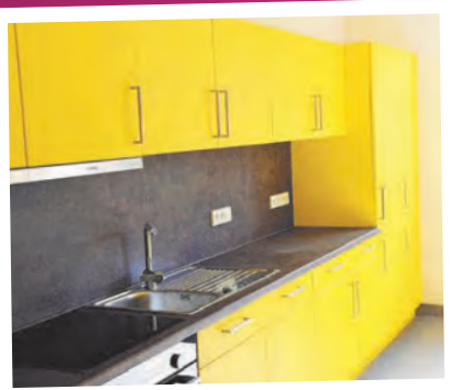
Die Küche im Aufenthaltsraum.