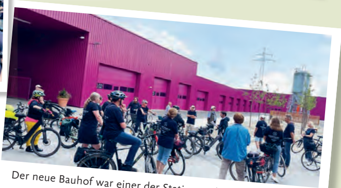
Der neue Bauhof war einer der Stationen der Ortsrundfahrt.