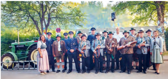
Die Böllerschützen nach dem 1. Weckruf.

„angeschossen“ wurde, erfolgten im Laufe des weiteren Vormittags rund um den Bürgerfestplatz weitere Ehrensalue zur Begrüßung aller geladenen Vereine sowie zur Ummalung des feierlichen Gottesdienstes im Festzelt. Auch die Böllerkameraden unserer Partnergemeinde Kamsdorf waren mit dabei.