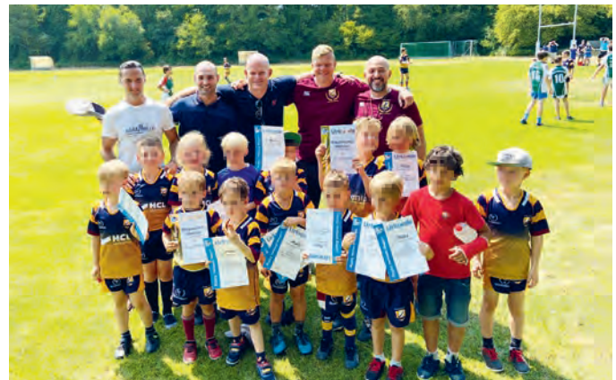
Der Rugbynachwuchs der U6 und U8 mit seinem Trainern.

wird Vize-Meister und die U10 Dritter. Zuvor hatte bereits die U16 in der SG München den fünften Rang bei der Deutschen Meisterschaft gefeiert.