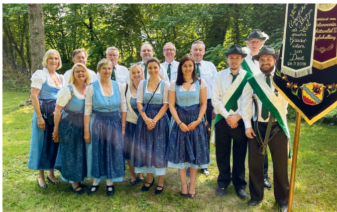
Teilnehmende Schützen beim Fronleichnamsumzug.

Am 8. Juni versammelten wir uns wieder mit vielen anderen Vereinen, Fahnenabordnungen und der Blaskapelle bei angenehmen Wetter zum Fronleichnamsgottesdienst in der schönen Isarau. Nach der Messe zogen wir alle gemeinsam mit vielen Unterföhringern singend und betend mit der Monstranz von Altar zu Altar. Anschließend ließen wir uns gerne wieder die Brotzeit im Pfarrzentrum schmecken und verbrachten einen schönen Vormittag. Wir bedanken uns bei allen Schützinnen und Schützen für die Teilnahme.