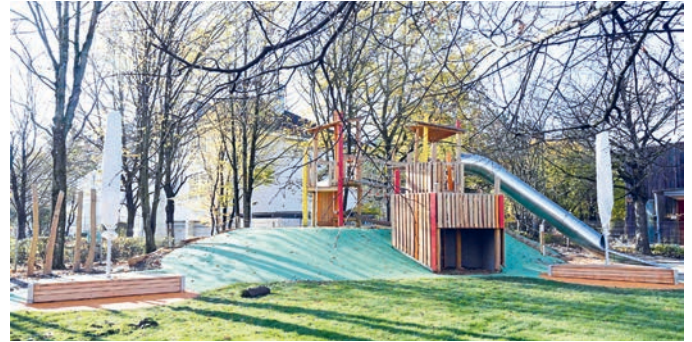
Toll hergerichtet und bereit für das Spiel der Kinder.

diesjährige Highlight war sicherlich die Band Schlawindl, die mit bayerischer Mundart und Rockmusik samt coolen Moves für Stimmung sorgte. Das reichhaltige Kuchenbuffet organisierte der Elternbeirat. Es gab leckere bayerische Köstlichkeiten, da war für jeden etwas dabei.