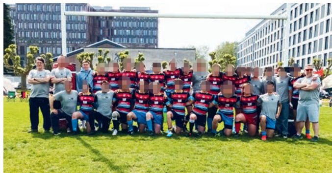
Die Spielgemeinschaft U16 in Frankfurt am Main.

Wer hätte das am Anfang der Saison gedacht? Konnten die Teams von MRFC, StuSta, St. Georges und RCU als Spielgemeinschaft München doch im vergangenen Herbst kaum 15 Jugendliche auf den Platz bringen, wurde diese Wahnsinns-Saison – nun mit über 25 Kindern – mit dem fünften Platz bei der Deutschen Meisterschaft belohnt.