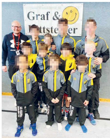
Das Team des SCI beim Walter-Bering Turnier in Nürnberg.