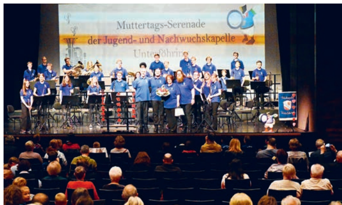
Muttertagsserenade im Bürgerhaus.

liebte und anspruchsvolle Klassiker wie The Lord of the Rings, Song and Dance sowie The Magnificent Seven.