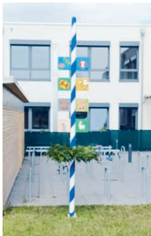
Unser wirklich schöner und selbst gestalteter Maibaum steht nun vor dem Kinderhaus.

In unserer schnelllebigen Gesellschaft ist die gemeinsame Zeit mit der Familie wertvoller als je zuvor. Unter diesem Motto stand unser Familienfest. Alle Familien waren am 16. Mai dazu eingeladen, in die Alltagswelt ihrer Kinder einzutauchen und sich gemeinsam in unserem Haus ein paar schöne Stunden zu machen. Es gab verschiedene Stationen in den Gruppenräumen der Krippe: Dosenwerfen im Mehrzweckraum, Schminken in der Hasengrube, Glitzer-Tattoos und Nägel lackieren in der Bärenhöhle, Bewegungsparcours im Fuchsbau sowie Haarkränze in der Alpakawiese binden. Zum Abschluss wurde ein lustiges Polaroidfoto von jeder Familie gemacht. Das Fest löste in diesem Jahr die gebastelten Mutter- und Vatertagsgeschenke ab.