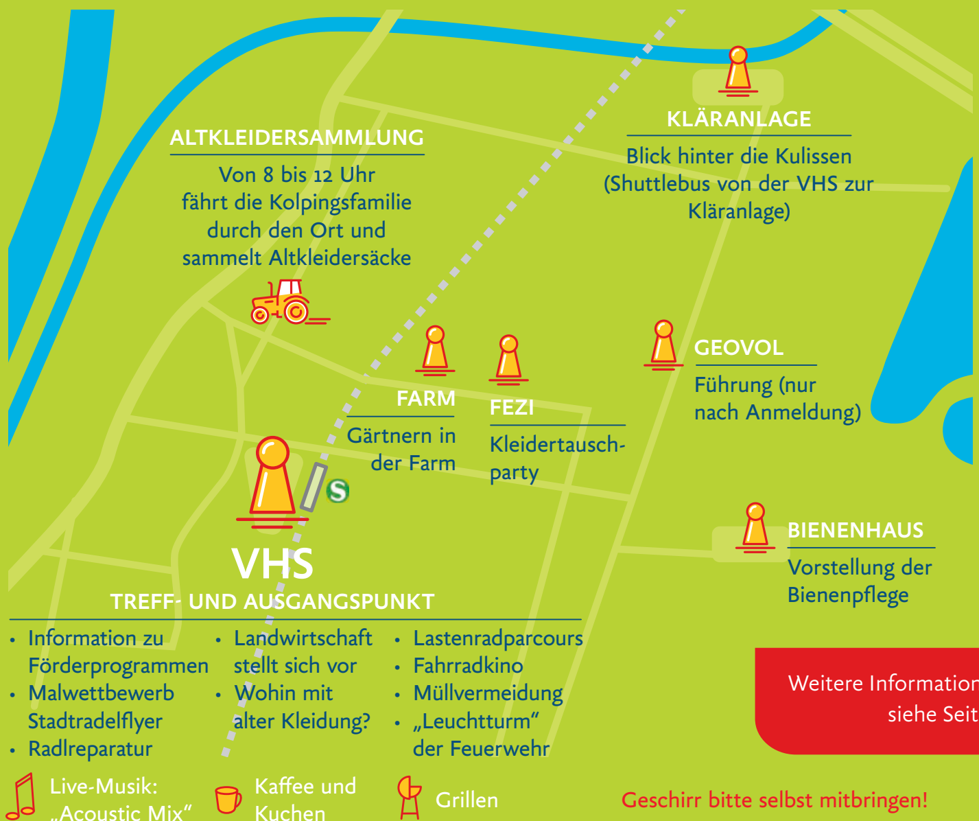
Abbildung: © Tausendblauwert.de