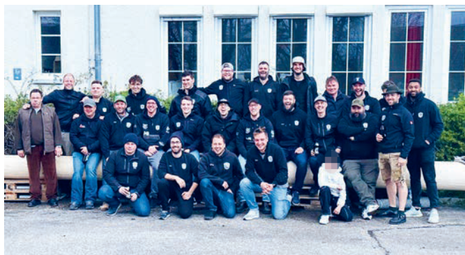
Erneute fette Beute: Die Maibaumdiebe vor dem Moosinninger Maibaum.

Am Mittwoch, 12. April gegen 5 Uhr morgens war es endlich so weit: Nach wochenlangem Planen und Auskundschaften, vielen schlaflosen Nächten und bereits zwei gescheiterten Versuchen, schlugen unsere Maibaumdiebe zu: Die Wachhütte am Moosinninger Maibaum wurde von außen verriegelt, die Wachhabenden somit eingeschlossen, und der Maibaum schnellstmöglich auf Nachläufer aufgeladen. Nach dem geglückten Diebstahl wurde der Heimweg nach Unterföhring von unserer Freiwilligen Feuerwehr abgesichert: vielen Dank noch einmal an dieser Stelle für die tolle Zusammenarbeit!