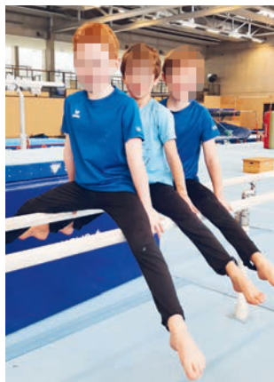
Nachwuchsturner des Jahrgangs 2016 haben beim TSV Unterföhring schon sichtbar viel Spaß.

Bettina Sittenauer (Abteilungsleiterin Turnen männlich)