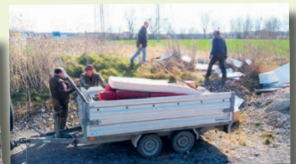
Sogar ein fast kompletter Hausstand wurde gefunden.

Bei ungewöhnlich warmem und schönem Wetter gingen die Jäger und Landwirte aus Unterföhring am 15. März nach zwei Jahren Zwangspause endlich wieder sämtliche Feldwege, Straßengräben und Gebüsche außerhalb des bebauten Gebietes von Unterföhring ab, um sie von Unrat zu befreien. Heuer kam beim Rama dama besonders viel Müll zusammen, was verschiedenen größeren illegalen Ablagerungen geschuldet war. Besonders überraschend waren zwei davon: 10 Säcke mit Mineralwolle, und in einer Kiesaufschüttung neben der Autobahn hat jemand eine fast komplette Wohnungsausstattung entsorgt. Von einer Couch über eine Matratze bis hin zu Küchenschränken. Es war fast alles dabei.