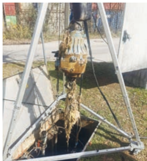
Eine verstopfte Abwasserpumpe aus dem Kanal an der Neubruchstraße.

wie beispielsweise Essensreste nichts in der Toilette verloren haben. Bitte werfen Sie auch keine Damenbinden, Kondome, Windeln, Feuchttücher und Wattestäbchen ins Klo, die gehören in die Restmülltonne. Das gilt auch für Katzenstreu und Zigarettenkippen.