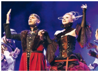
Shakespeares rockiger Hamlet im Bürgerhaus.

Am Mittwoch, 19. April um 20 Uhr heißt es: „Rock me, Hamlet“. Das Ensemble der Opernwerkstatt am Rhein verbindet in dem Musical klassische Shakespeare-Texte mit aktueller Rockmusik. Die mitreißende Inszenierung im Bürgerhaus ist gespickt mit Songs, die von den 80er-Jahren bis heute reichen: von Kate Bushs poetisch angehauchtem „Breathing“ bis zum provokativen „Fuck you“-Schlachtruf von Lily Allen. Und auch der eher rhythmisch-schroffe „Logical Song“ von Supertramp wird mit dem berühmten Hamlet-Monolog kunstvoll in einen neuen Einklang gebracht. Aufwendige Kostüme im Steampunk-Stil, beeindruckende Fechtkämpfe und der Auftritt großer Puppen zählen zu den herausragenden Extras – mit Live-Band!