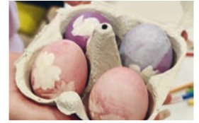
Schöne blumige Ostereier mit Naturfarben.

Wenn wir das erfolgreich geschafft haben, gibt es zur Belohnung leckeres Stockbrot. Uhrzeit und Ort geben wir bald über Social Media und im Gemeindeblatt bekannt.