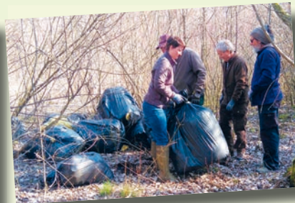
Bergung von Mineralwolle, die in mehreren Säcken verpackt ist.