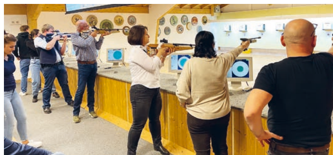
Die Finalisten am Schießstand.

Am 24. März fand das traditionelle Gemeinderat-Vergleichsschießen im Schützenheim statt, bei dem wir neben den Gemeinderäten und Gemeinderätinnen natürlich auch deren Begleitungen willkommen hießen. Nachdem sich alle Gäste mit einem super leckeren Essen gestärkt hatten, ging es an den Schießstand.