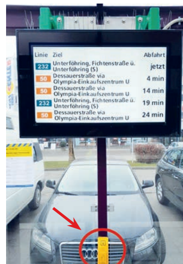
So sieht der DFI-Anzeiger an der Bushaltestelle Feringastraße aus. Der gelbe „Text-to-Speech-Taster“ (Vorleseknopf) ist in erreichbarer Höhe angebracht.

Wie vom Gemeinderat in seiner Sitzung am 18. Juni 2020 beschlossen, wurde im Januar 2023 an der Bushaltestelle Feringastraße Ost mit der Installation eines Dynamischen Fahrgastinformations-Anzeigers (DFI-Anzeiger) begonnen. Es handelt sich um elektronische Anzeigetafeln, auf denen die Fahrgäste die nächs-