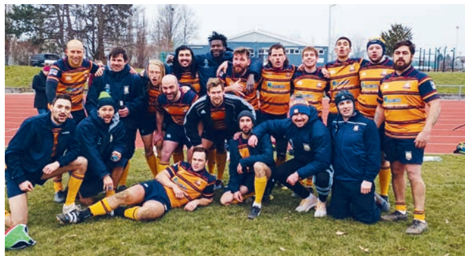
Die Herrenmannschaft in Stuttgart.

Das erste Spiel der Rückrunde findet am Samstag, 25. März zuhause gegen Nürnberg statt.