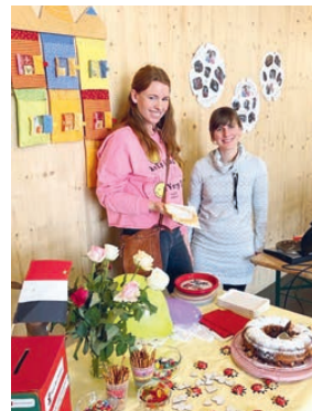
Engagierte und tatkräftige Unterstützung aus dem Elternbeirat.

Liebe Familien aus Unterföhring, der Elternbeirat des Kinder- hauses hatte beschlossen, für die Kinder im Erdbebengebiet der Türkei und Syrien Spenden zu sammeln. Dafür wurde ein tolles Elterncafé am Tag der offenen Tür mit vielen süßen und herzhaften Speisen auf die Beine gestellt. Die Aktion lief so her- vorragend, dass einige Tage später einige Eltern aus dem Eltern- beirat einen wahrhaftigen Waffelbackmarathon im Kinderhaus veranstalteten, der bei Groß und Klein super ankam.