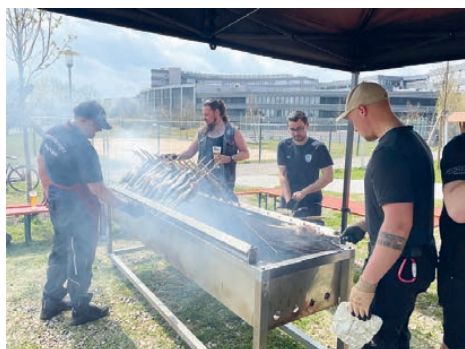
Die Burschen grillen wieder leckere Forellen.

Am Karfreitag, 7. April werden wir wieder unseren legendären Steckerlfisch für Euch am Feststadl, Etzweg 12, grillen. Von 11.30 bis 14.30 gibt es die ersten 120 Forellen, von 16 bis 18.30 Uhr gibt es die zweiten 120 Forellen. Damit ein griabiges Zusammensein garantiert ist, gibt es in einem kleinen Biergarten ab 11.30 Uhr Augustiner vom Holzfass und alkoholfreie Getränke.