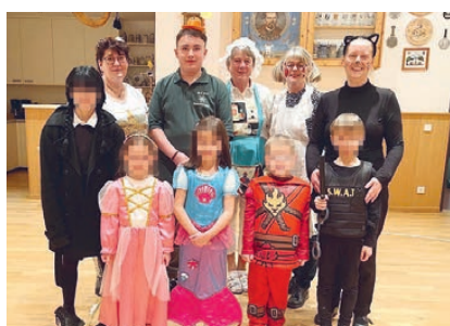
Die Trachtenjugend.

Am 17. Februar traf sich die Trachtenjugend zu einer närrischen Jugendprobe. Alle kamen in lustigen Kostümen und mit viel Vorfreude ins geschmückte Vereinsheim. Neben lustigen Spielen wie Luftballontanz und Würschtlschnappen haben wir auch fleißig unsere Volkstänze geprobt und uns mit Krapfen und Apfelschorle gestärkt. Alle hatten viel Spaß bei dieser etwas anderen Probe!