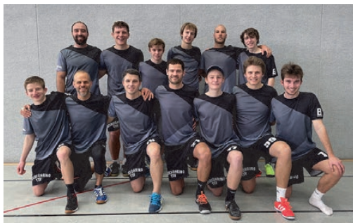
Die Herrenmannschaft der Zampferl.