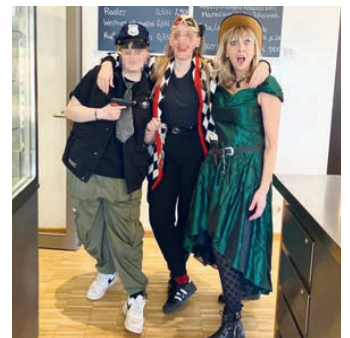
Das Team vom Café Valentin feierte mit.

Farbe, Freude und Musik tun uns allen gut. Live erleben konnte das, wer am Faschingsdienstag - mit oder ohne Verkleidung - im liebevoll geschmückten Café Valentin den Auftritt der Faschingsgesellschaft Feringa miterleben durfte. Nicht nur legte die junge Garde gut eine Stunde einen bühnenreifen schwungvollen Auftritt zur Freude aller Besucher hin, spontan gab es noch eine Zugabe, bei der die junge und alte Garde zeigten, dass sie die bekannten Tanzeinlagen auch wunderbar gemeinsam darbieten können. Herzlichen Dank für diesen schönen Nachmittag!