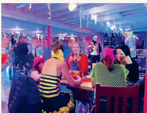
Die „Weiber“ im Sportlerheim des FCU.

sen und Getränke und die attraktiven Partymaker. Felix, Bogi, Robert, Lucki und Sebbi hinter der Bar heizten die Stimmung unter anderem mit Polonaise kräftig an. Großer Dank an Robert von den Burschen, der die Idee hatte, den Gewinn (und Trinkgeld der Barkeeper) an den Kinderkrebsverein München zu spenden und uns auch gleich die Boxen und Plakate dazu organisiert hat.