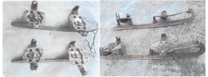
Alte Schlittschuhe.

Vergnügen. Die Eisflächen am Löschweiher in der Isarau und am Poschinger Weiher luden zum Schlittschuhfahren ein - falls solche Ausrüstung bei den Familien schon vorhanden war. Diese urtümlichen Schlittschuhe wurden seitlich mit Schrauben an den Absätzen befestigt und angeklammert. Dazu benötigte man einen speziellen Schraubenschlüssel. Dieses System wurde auch „Stöckkreißer“ genannt, da bei seitlichen Verkanten oft der Stöckl (Absatz) abbrach und dann der Schuster wieder helfen musste.