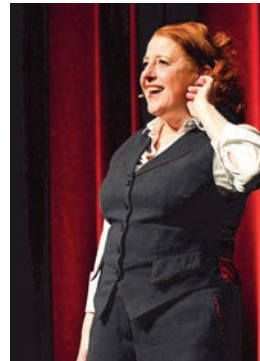
Luise Kinseher im Bürgerhaus.

Ausverkauft bis auf den letzten Platz hieß das Unterföhringer Publikum die bayerische Star-Kabarettistin Luise Kinseher vergangene Woche im Bürgerhaus willkommen. Die vielfach ausgezeichnete Künstlerin, vielen auch wohl bekannt als Mama Bavaria, „strich die Wände und setzte Segel“. Die Präsentation ihres neuen Solo-Programms begeisterte, der Funke sprang von der Bühne sofort ins Publikum über. Mit frenetischen Beifall feierten die Kabarett-Fans Luise Kinseher und ihren großartigen Auftritt, woraufhin die Künstlerin gerne mehrere Zugaben gab.