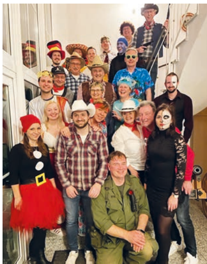
Die narrischen Schützen.