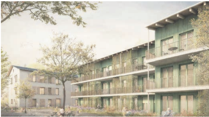
Das neue Wohnungsbauprojekt an der Münchner Straße 85.

Einen großen Schritt vorangekommen ist der Gemeinderat mit dem Wohnungsbauprojekt an der Münchner Straße 85, ehemals Wehnerhof. 27 Wohneinheiten werden dort in drei Häusern entstehen, beschlossen die Gemeinderatsmitglieder in ihrer jüngsten Sitzung nun einstimmig und endgültig, nachdem unter anderem noch flexibel veränderbare Wohnungs-Varianten angedacht und geprüft worden waren. Für Junge und Alte, ebenso für Familien werden nun Mehrgenerationen-Wohnangebote geschaffen. Im Haus 1 sind es zwölf Wohnungen zwischen etwa 35 und 46 Quadratmetern, im Haus 2 werden neun Wohneinheiten zwischen etwa 50 und 58 Quadratmetern geschaffen, in Haus 3, demjenigen, das auf dem Grundstück am nächsten zum Isarhang steht, sind es sechs Wohnungen zwischen 74 und 97 Quadratmetern. Beschlossen wurden außerdem zwei rollstuhlgerechte Parkplätze in der Tiefgarage und ein weiterer oberirdischer Stellplatz.