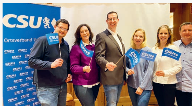
Der neugewählte Ortsvorstand.