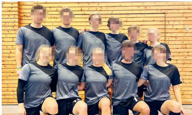
Die Zamperl in Hauzenberg.