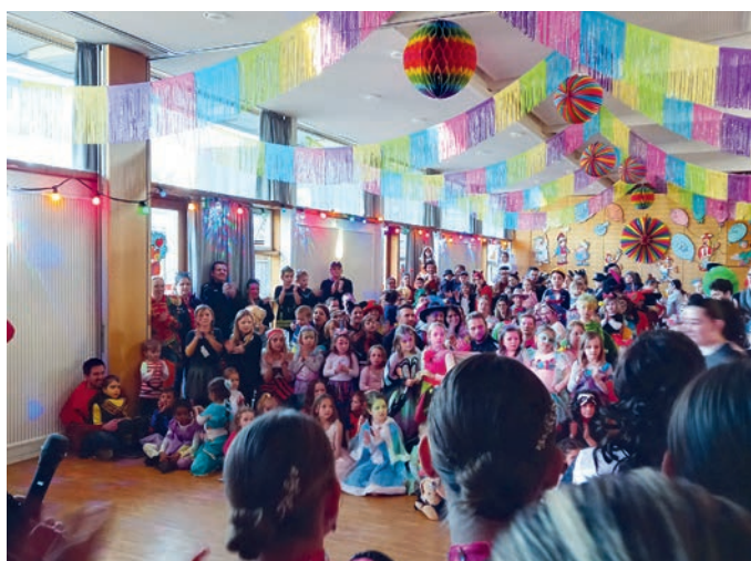
Schöne Kostüme und große Begeisterung beim Kinderfaschingsball der Kolpingsfamilie.