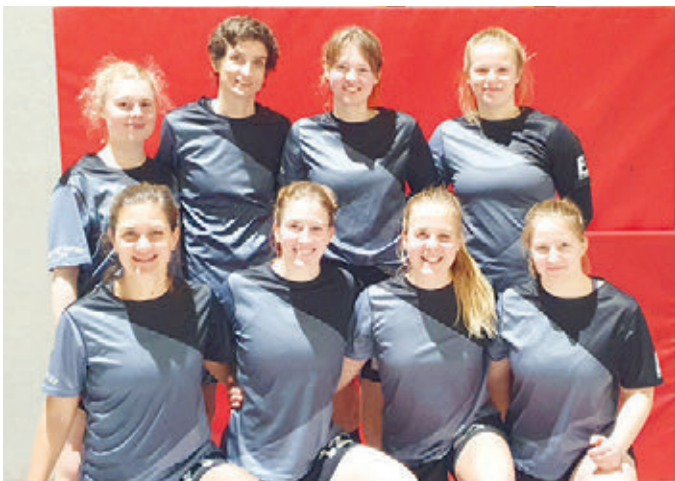
Die Zamperl-Damen hoffen auf den Sprung in die 1. Liga.

Das junge Team der Zamperl-Herrenmannschaft erwischte einen guten Start in der 1. Liga, die in Wuppertal ausgetragen wurde und gewann die ersten beiden Spiele gegen Düsseldorf mit 15:11 und gegen Aachen mit 15:10. Im dritten und letzten Samstagsspiel ließen die Kräfte etwas nach. Daraus resultierte die erste - und wie sich zeigen sollte, letzte - Niederlage des Wochenendes gegen das Team aus Bönningheim. Durch Siege am Sonntag gegen Köln (13:9) und gegen den amtierenden Vizemeister „Die hässlichen Erdferkel Marburg“ in einer hochklassigen Partie mit 13:11 haben die Zamperl noch immer gute Chancen, am 2. Wochenende der Deutschen Meisterschaften Ende Februar in Eppelheim den Titel nach Unterföhring zu holen.