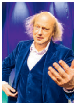
Arnulf Rating.

Am Samstag, 18. Februar um 20 Uhr gastiert ein Meister der spitzen Zunge in unserem Bürgerhaus: Arnulf Rating. Der vielfach ausgezeichnete Kabarettist (u.a. Bayerischer Kabarettpreis 2019) seziert hinter sinnig die Geschehnisse und Behauptungen in Politik und Medien. In seinem Programm „Zirkus Berlin“ betreibt der Spötter aus der Hauptstadt mit hohem Tempo und Unterhaltungswert Aufklärung im besten Sinne und vor allem mit seinem effektivsten Werkzeug: dem Humor.