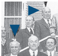
Wer kennt die beiden Männer?