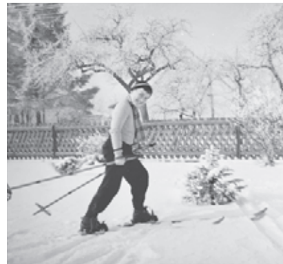
Der Autor mit Ski und Bambusstecken im Winter 1956.

So begab ich mich zum Stoffe-Berg, stieg mal einige Meter hoch und fuhr dann geradewegs ab. Wenn dies sturzfrei gelang, wagte ich mich immer höher. Die langen Ski konnten von mir nicht um die Kurve bewegt werden. Erst einige Versuche später und unter Mithilfe meiner Kameraden lernte ich den „Kriste“, das abrupte Bremsen mittels Stock-Einsatz und einer 90-Grad-Bremse. Im heutigen Skilehrplan nennt man das elegant „Christiana-Schwung“. Natürlich entwickelten wir Kinder auch Wettbewerbe: „Weitfahren“ auf der Wiese unterhalb des Berges, mit Schwung von möglichst weit oben, und Skispringen, auf einem Absatz im Hang mit ausgebaute Schanze. Mit „Ast-Steckerln“ wurde die erreichte Leistung jeweils markiert.