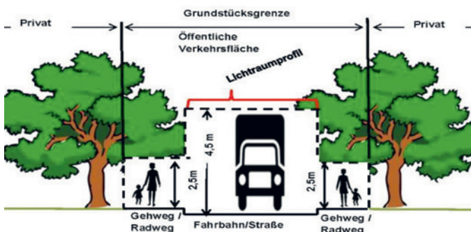
Grafik: Gemeinde Unterföhring

Folgende Mindestmaße können Ihnen als Orientierung dienen: