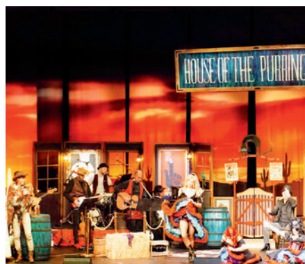
„The wild Wild West at its best“ im Bürgerhaus.

Schauspiel, Live-Konzert, Musical? Das Publikum bekommt alles: Am Mittwoch, 8. Februar um 20 Uhr kommt mit „I love Bandits – The True Story of Etta Place“ ein furioses Country- und Western-Musical zwischen rauchenden Colts und großen Gefühlen ins Bürgerhaus. Das Musical schießt die größten Hits der letzten Jahrzehnte locker aus der Hüfte und trifft damit voll ins Schwarze. Mit den schönsten Hymnen, Krachern und Balladen von Dolly Parton, Kenny Rogers, Willie Nelson, Johnny Cash und Co. Mal nah am Original, mal von der Live-Band rhythmisch und soundmäßig aufgepeppt, dass die Whiskeygläser auf den Saloon-Tischen scheppern. Ein amüsantes, emotionsgeladenes Spektakel.