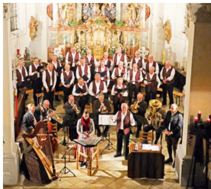
Alle Mitwirkenden beim „Andachtsjodler“.

Wir selbst bezeichnen den Unterföhringer Advent in unseren Ankündigungen als eine „besinnliche Stunde“ in der „stimmungsvollen Atmosphäre“ der katholischen Pfarrkirche St. Valentin. Dass ein „stimmungsvolles“ Advents-Konzert aber nicht zwangsläufig streng „besinnlich“ und „feierlich“ sein muss, das zeigte dieser 17. Unterföhringer Advent am dritten Adventsonntag. Denn die Musikstücke der beiden Instrumentalgruppen, der „Frühmusi“ aus Brunntal und der „Kiramer Weisenbläser“, wechselten zwischen beschwingtem und getragenen und auch modernem Charakter. Dazu kamen heitere Wortbeiträge und Geschichten von Konrad Pech und dazu unsere Lieder, die den Aufbruch der Adventszeit symbolisierten. In dieser positiven Atmosphäre konnten wir den vielen Besuchern eine ganz besondere Einstimmung auf Weihnachten anbieten. Dabei fehlte auch nicht der traditionelle „Andachtsjodler“, der wie immer den gemeinsam gesungenen und gespielten Abschluss bildete.