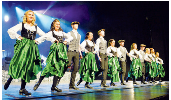
Die Danceperados of Ireland.