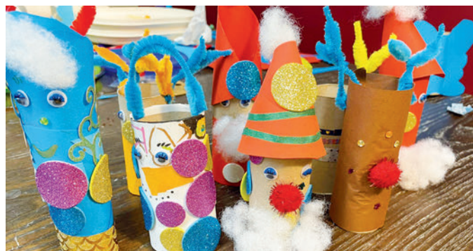
Adventsbasteleien des Farm-Treffs.

Im Januar starten wir wieder mit neuen Aqua-Fitness-Kursen. Das gelenkschonende Training hat positive Effekte auf die körperliche Fitness vor und nach der Geburt, kann typische Schwangerschaftsbeschwerden lindern und sorgt auch beim Ungeborenen für Wohlbefinden. Ein Kurs umfasst fünf Termine à 45 Minuten (einmal pro Woche) und kostet 50 Euro. Kurse werden jeweils dienstags und mittwochs angeboten. Anmeldung per E-Mail an das Familienhaus.