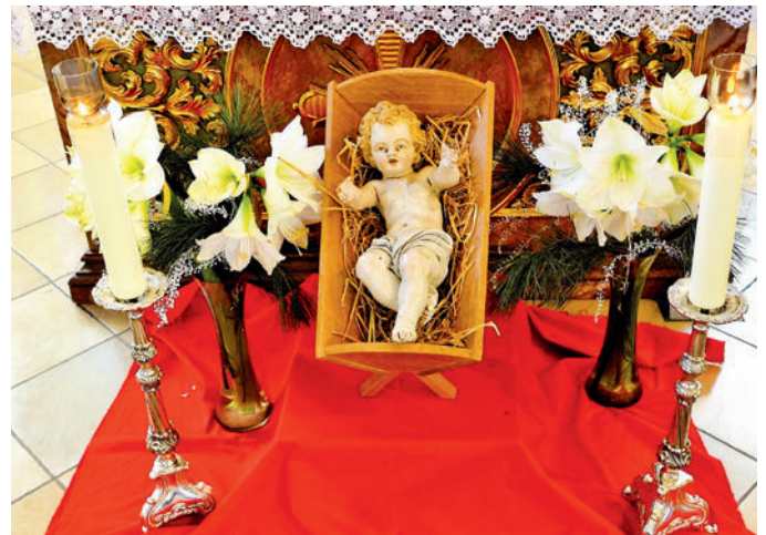
Die Geburt des Herrn feiern - die Krippe in St. Valentin.

Maria und Josef in Nazaret treffen, bei den Hirten am Feuer vorbeischaun und schließlich zum Kind in der Krippe kommen. Von dort ein Licht des Friedens mit nach Hause nehmen - dazu sind die Kinder und ihre Familien am Heiligen Abend eingeladen. In drei Stationen erzählen, spielen und feiern wir die frohe Botschaft von Weihnachten. ★