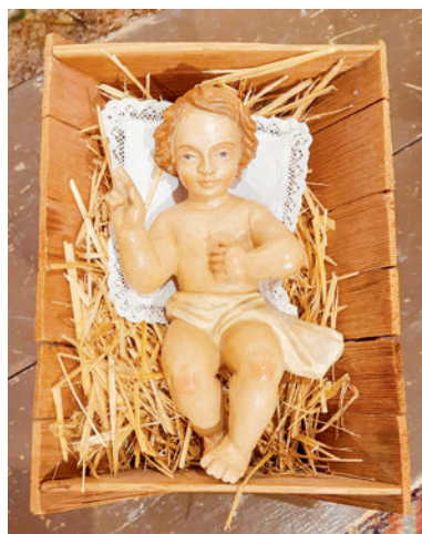
Aus unserer Museumsammlung: Das handgeschnitzte Jesuskind aus dem 20. Jahrhundert.

Im März 2011 ist es von der österreichischen Unesco-Kommission als Kulturerbe aufgenommen worden. Dieses festliche Lied gilt bis heute als Zeichen des Friedens, das für viele Menschen gerade in diesen schweren Zeiten Hoffnung und Trost spenden kann.