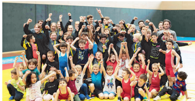
Die Schülermannschaft und die Bambinis des SCI.