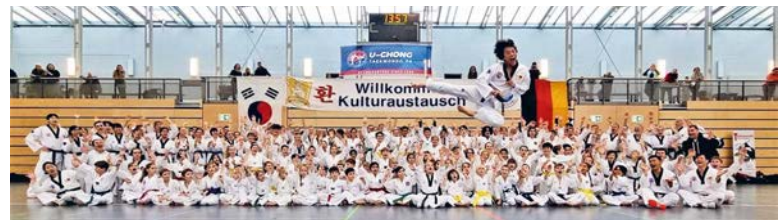
Gruppenfoto vom Lehrgang im Sportzentrum.

U-Chong bedeutet übersetzt Freundschaft und die „tiefe, innere Beziehung zu anderen“ – und damit auch wieder zu sich selbst. Diese koreanischen Werte und diese Freundschaft sind wesentliche Bestandteile der U-Chong-Family, der der TSU seit einigen Jahren angehört.