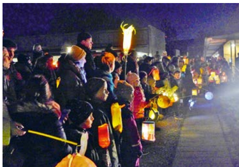
Martinsumzug in Unterföhring.

Sehr viele Familien waren gekommen, um tagesgenau am 11. November das Fest von St. Martin wieder gemeinsam zu feiern. Für die Mehrzahl der Kinder dürfte es das erste Mal gewesen sein, liegt der letzte Martinsumzug in Unterföhring doch schon drei Jahre zurück. Vom Auftakt bei der evangelischen Rafaelkirche bewegte sich der lange Zug, angeführt vom heiligen Martin auf seinem Pferd, zum katholischen Pfarrzentrum, wo auf der Wiese das Thema der Feier szenisch dargestellt wurde. St. Martin, der römische Soldat, teilt mit dem Schwert seinen warmen Mantel und reicht eine Hälfte dem frierenden Bettler, damit der Arme sich einhüllen kann. Diesen Akt der christlichen Barmherzigkeit können auch Kinder schon gut verstehen, weshalb St. Martin zu den populärsten Heiligen gehört und als zeitloses Vorbild wirkt. Dazu die schaukelnden Lichter der farbigen Laternen, die in der Dunkelheit stimmungsvoll leuchteten, der Auftritt mit dem Pferd, das gemeinsame Singen der Martinslieder – rabimmel, rabammel, rabumm – und die harmonischen Klänge der Blasmusik, die den musikalischen Rahmen setzten, das alles konnte die Kinderseelen schon sehr beeindruckend.