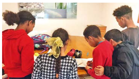
Beim gemeinsamen Lernen.

An der Bauhofstraße wohnen inzwischen eine Reihe junger Mütter aus Afghanistan, die kleine Kinder haben und deshalb nicht an den regulären Sprachkursen teilnehmen können. Für die Integration der Familien ist es besonders wichtig, dass die Mütter rasch Anschluss an unsere Gesellschaft finden und so zum Vorbild für die ganze Familie werden. Und auch dazu ist die Sprache unerlässlich.