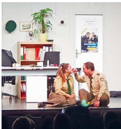
Die Polizei in Odlbaching.

Liebe Theaterfreunde, an unserem Premierenwochenende konnten wir unsere Zuschauer mit dem lustigen Stück „Dümmer als die Polizei erlaubt“ begeistern; auch die beiden Autoren waren hoch erfreut.