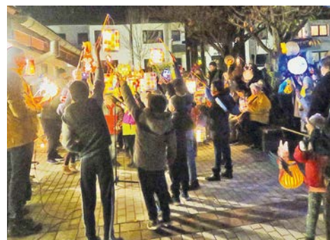
Viele Laternen und strahlende Kindergesichter.

Auf der Wiese des Pfarrzentrums leitete das Martinslied zum Höhepunkt über: einer pantomimischen Umsetzung der Martinsgeschichte durch Kinder und Jugendliche der katholischen Gemeinde. Auf das Spiel folgte ein geistlicher Abschluss mit Fürbittengebet und Segen.