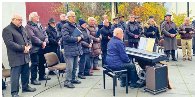
Die Sänger warten auf ihren Einsatz.

Seit der Einführung des „Volkstrauertags“ vor fast 100 Jahren ist dieser ein traditioneller Pflichttermin für den Männergesangverein. Das galt auch vor genau 70 Jahren bei der offiziellen Wiedereinführung dieses Gedenktags nach dem zweiten Weltkrieg. Damals zogen die Sänger mit ihrer neuen Fahne, die kurz zuvor geweiht worden war, zur katholischen Pfarrkirche, um dort die „Haydn-Messe“ zu singen.