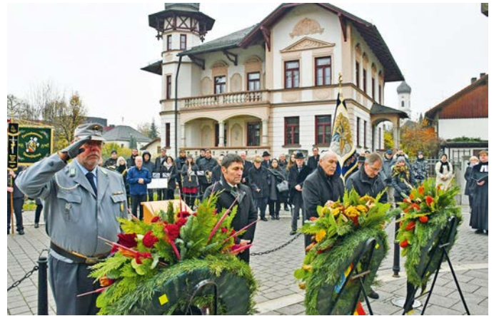
Kranzniederlegung am Kriegerdenkmal.

Mit einem stimmungsvollen Gottesdienst unter dem Marktdach vor dem Bürgerhaus und einer feierlichen Kranzniederlegung am Kriegerdenkmal haben am 13. November die Unterföhringer Vereine, Bürgerinnen und Bürger den Volkstrauertag begangen. Wie überall in Deutschland wurde dabei der Opfer der beiden Weltkriege, von Krieg und Gewalt, von politischer und religiöser Verfolgung gedacht. Begleitet von der Musik der Blaskapelle, den Liedern des Männergesangsvereins und dem Ehrenschat der Böllerschützen war es ein bewegendes Ereignis.