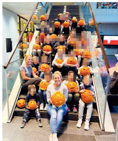
Die Kinder mit ihren Kürbissen im Bürgerhaus.

Die Abteilung Jugend ist um eine weitere Veranstaltung reicher! Unser erstes Kürbisschnitzen war ein voller Erfolg, mit einem Gewusel von 26 Kindern im Alter zwischen 3 bis 10 Jahren. Erst durften sich die Kinder einen Kürbis aussuchen, dann ging es in die Kreativwerkstatt ins Bürgerhaus. Die Kinder waren alle voll dabei und hatten so einige Ideen, wie ihr Kürbis aussehen sollte. Durch die Hilfe einiger Eltern gab es keine Schwerverletzten! Die Kürbisse wurden vom Gartenbauverein gesponsert. Ein dickes Danke geht auch an unseren Bauern, Herrn Knap aus Haimhausen, der uns die Kürbisse bis vor das Bürgerhaus lieferte. Wir freuen uns schon auf das Kürbisschnitzen im nächsten Jahr!