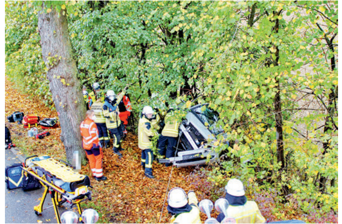
Am 22. Oktober musste die Feuerwehr einen Unfallwagen aus den Bäumen an der Münchner Straße bergen.

löschten sie brennenden Unrat im Freien, einen Tag später den Brand eines Müllbunkers.