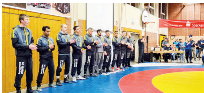
Die Männermannschaft in Mietraching.