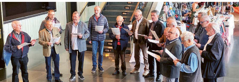
Auftritt im Bürgerhaus.

Dank für die Gastfreundschaft. Musikalisch haben wir uns dabei vom Jodler auf der Galerie, bayerisch auf der Treppe, bis hinunter zum Foyer mit einigen Liedern aus unserem Repertoire bewegt. Die Überraschung hat funktioniert, denn die Resonanz war überaus positiv. Uns hat es sowieso Spaß gemacht und wir überlegen uns schon den nächsten spontanen Auftritt.