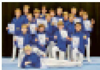
Unsere Nachwuchs-Gerätturner der E- und D-Jugend.