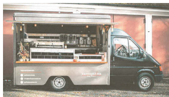
Die mobile Kaffeebar.

Bei Fragen zur Stand-Bewerbung wenden Sie sich gerne an Frau Fritsche im Rathaus unter Tel. 950 81-135 oder per E-Mail an fritsche@unterfoehring.de .