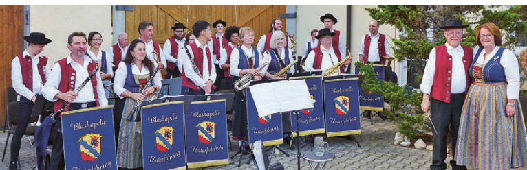
PWU-Kirchweihfest im Zehetmair-Hof.