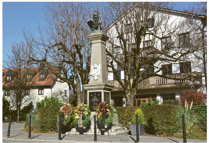
Am Kriegerdenkmal werden Kränze niedergelegt.

am Sonntag, 13. November , ist Volkstrauertag. Wir gedenken an diesem Tag bundesweit der Opfer der beiden Weltkriege, der Soldaten genauso wie der Frauen, Kinder und Männer, die in den besetzten Gebieten und in Deutschland Opfer von Krieg und Gewalt wurden. Wir erinnern auch an die aus politischen, religiösen und rassistischen Gründen Verfolgten, die in Konzentrations- und Vernichtungslagern getötet wurden. Gerade in dieser Zeit, in der in Europa wieder ein Krieg Menschenleben zerstört, ist es wichtig, sich die Schrecken der beiden Weltkriege noch einmal vor Augen zu führen und sie nie zu vergessen. Der Volkstrauertag ist eine Mahnung zum Frieden.