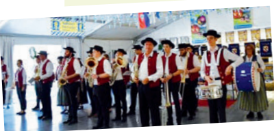
Die Blaskapelle spielte beim großen Bierfest in Tarcento auf.