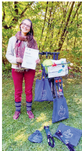
Wir freuen uns über die hilfreichen Radlschlösser und Sattelabdeckungen, und wünschen allen eine sichere Fahrt!

Wir freuen uns sehr, dass sich so viele Radler:innen unserem Team „Netzwerk Zukunft UnterFAIRing & UFG-unverpackt“ angeschlossen haben. Mit unserem 1. Platz haben wir im Team ein tolles Zeichen zur CO 2 -Einsparung setzen können: 7.739 km, 1.192 kg CO 2 . Wenn Ihr fleißigen Mitradler:innen nicht nur im Aktionszeitraum so viel radelt, sondern auch unterm Jahr, können wir wirklich einen Unterschied bewirken.