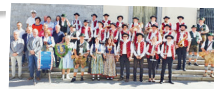
Die Böllerschützen und die Blaskapelle vor dem Dom in Tarcento.