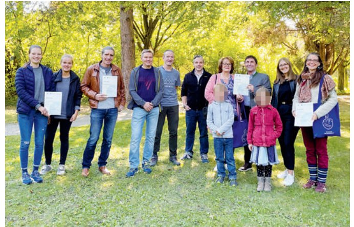
Preisverleihung der erfolgreichsten Unterföhringer Radler mit Bürgermeister Andreas Kemmelmeyer.

Am 22. September gratulierte Bürgermeister Andreas Kemmelmeyer den Siegern von Unterföhring im Rathausgarten zur erfolgreichen Teilnahme. Die Zahl der Stadtradler wachse seit dem ersten Mal 2015 von Jahr zu Jahr. Auch deshalb bemühe sich die Gemeinde weiter intensiv um Verbesserungen für die Radler.