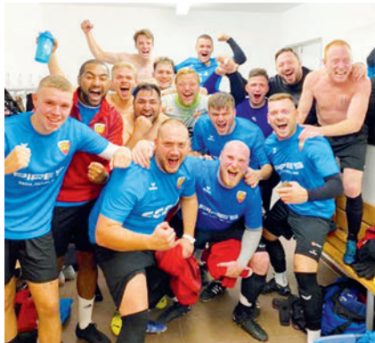
Die siegreiche 3. Mannschaft.