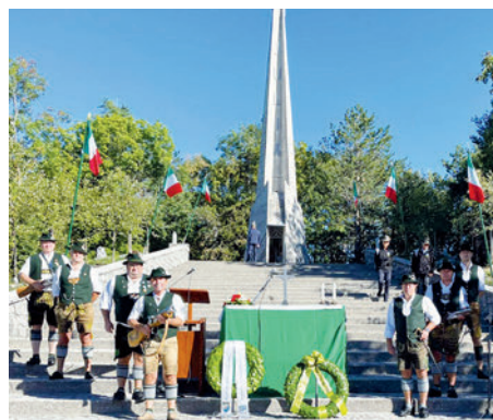
In Tarcento beim Kriegerdenkmal auf dem Monte Bernadia.