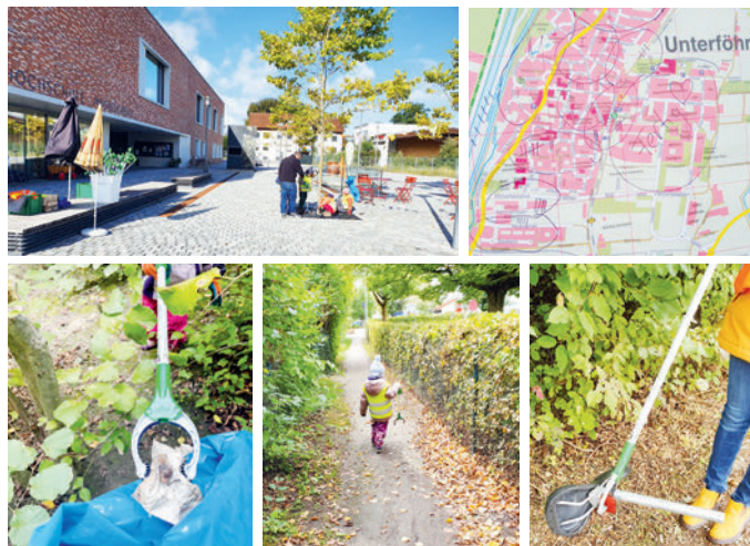
Impressionen vom Unterföhringer World Cleanup Day.