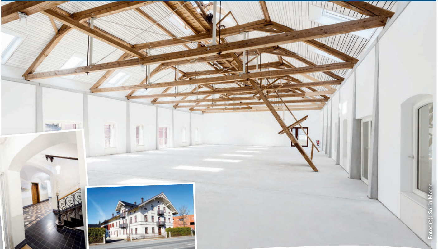
Der Heuspeicher im Fuchshof.