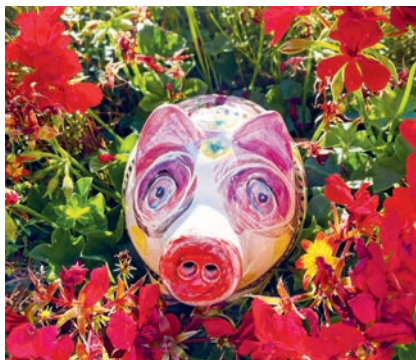
Das Unterföhringer Spenden-Schweinderl steht an der Bürgerinfo im Rathaus bereit.

Ende Februar 2021 beschloss der Kreisausschuss, einen auf Spenden basierenden Corona-Nothilfefonds für unverschuldet durch die Pandemie in Not geratene Landkreisbürger:innen einzurichten. Nach wie vor steht unser Spenden-Schweinderl im Rathaus an der Bürgerinfo und wartet darauf gefüttert zu werden.