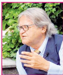
Diskussionsabend mit Helmut Markwort in Unterföhring.

Ist der öffentlich-rechtliche Rundfunk (kurz ÖRR) in seiner heutigen Form noch finanzierbar und gesellschaftsrelevant? Die Freien Demokraten aus Unterföhring und Ismaning diskutieren zum Thema ÖRR mit einem der profiliertesten und meinungsstärksten deutschen Journalisten – mit Helmut Markwort. Das Thema des Abends: „Der öffentlich-rechtliche Rundfunk - Wie grün ist die ARD?“ Wir laden Sie herzlich zum Diskussionsabend am Samstag, 10. September ab 18.30 Uhr im Wirtshaus am Medienpark mit Helmut Markwort ein.