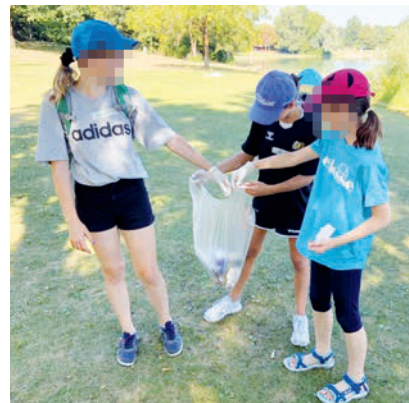
Fleißige Schüler:innen beim Plogging.

Ende Juli, am Projekttag des Gymnasiums, widmeten sich 30 Schülerinnen und Schüler einer neuen Trendsportart: Plogging. Plogging ist ein Schachtelwort, das sich aus dem schwedischen Wort plocka, das „aufheben“ bedeutet, sowie dem englischen Wort jogging zusammensetzt. Wer also ploggt, verbindet die Laufstrecke mit dem Umweltschutz, indem auf der Laufstrecke herumliegender Müll eingesammelt wird. Und genau dem sind die Schülerinnen und Schüler des Gymnasiums nachgekommen.