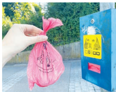
Bitte nutzen Sie für die Hinterlassenschaft Ihres Vierbeiners die Hundekotbeutel, die Ihnen kostenfrei zur Verfügung stehen.

Wir haben in Unterföhring viele Hundehalter und noch viel mehr Hundeliebhaber. Doch die Hinterlassenschaften der Vierbeiner erfreuen niemanden, weshalb wir im gesamten Gemeindegebiet eine Vielzahl von Spendern für Hundekotbeutel aufgestellt haben.