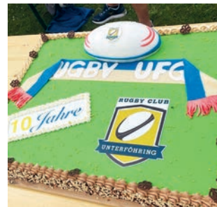
Die RCU-Geburtstagstorte zum zehnjährigen Vereinsjubiläum.