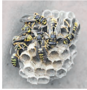
Ein Wespennest.

Sie haben ein Insektenest in Ihrem direkten Wohnumfeld entdeckt? Wer oft Wespen, Hornissen, Hummeln oder Bienen in seinem Garten oder um den eigenen Balkon sieht oder gar ein Nest findet, sollte zunächst wissen, womit er es zu tun hat. Insekten, die Nester bauen sind nach dem Bundesnaturschutzgesetz geschützt und dürfen als wildlebende Tiere nicht absichtlich beunruhigt, gefangen, verletzt oder getötet werden.