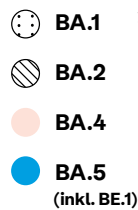
Entwicklung der Omikron-Varianten

Omikron war schon immer ansteckender als frühere Virusvarianten. Die Sublinie BA.5 (inkl. BE.1) von Omikron macht einen großen Teil der Sommerwelle aus und verbreitet sich rasant, auch weil persönliche Schutzmaßnahmen abgenommen haben und weniger Menschen Maske tragen. Auch wer 3-fach geimpft oder genesen ist, kann sich mit BA.5 (inkl. BE.1) anstecken.