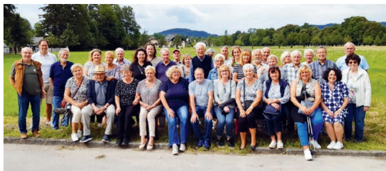
Die Laienspielgruppe in Salzburg.

Liebe Vereinsmitglieder und Freunde der Laienspielgruppe, unser diesjähriger Vereinsausflug führte uns mit Vogel-Reisen zeitig in die schöne Mozartstadt nach Salzburg. Nach einer Pause an der Raststätte Samerberg mit einer vorbereiteten Brotzeittüte, fuhren wir auf direktem Weg an unser Ausflugsziel. Im Anschluss an die für jeden Teilnehmer frei verfügbare Zeit (u.a. Besuch Grünmarkt, Salzach, Schloss Mirabell, Getreidegasse, Geburtshaus Mozart u.v.m.) ging es weiter zu den Hellbrunner Wasserspielen. Einige erfrischenden Überraschungen, die sehr lustig waren, rundeten den Besuch ab. Auf dem Nachhauseweg kehrten wir im Bräustüberl Schönramer ein, genossen das gemeinsame Abendessen bei netten Gesprächen und kamen wieder gegen 23 Uhr gut zu Hause an.