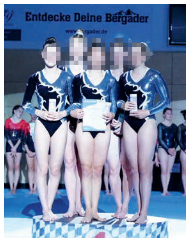
Die Turnerinnen in Waging.

Am zweiten Landesligawettkampf in Waging am See konnten die Mädels der Landesliga 1 mit starken und sicheren Übungen punkten und erreichten den ersten Platz.