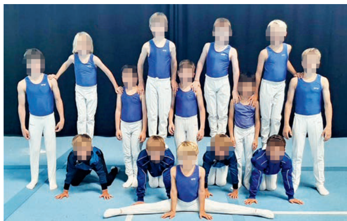
Die jungen Turner bei den Oberbayerischen Meisterschaften.