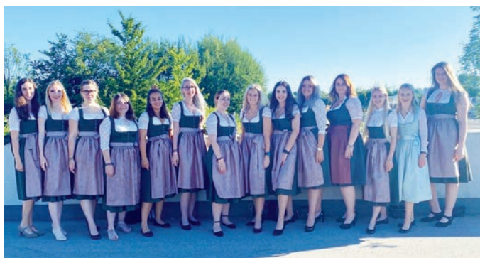
Die Unterföhringer Deandl.

Anfang Juli war's endlich soweit - die Fahnenweihe unserer Unterföhringer Burschen fand statt! Lang haben wir voller Vorfreude auf dieses Wochenende gewartet. Es war ein grandioses Festwochenende und vor allem die Fahnenweihe war ein besonderer Tag, an diesen wir uns viele Jahre gern zurückerinnern werden. Jungs, wir sind sehr stolz auf Euch, dass Ihr so ein großartiges Fest auf die Beine gestellt habt! Wir bedanken uns bei jeder einzelnen Person, die dazu beigetragen hat, dass diese Festtage so erfolgreich verlaufen konnten! Unser Burschenverein hat mit diesem Wochenende mal wieder deutlich bewiesen, dass man als Gemein-