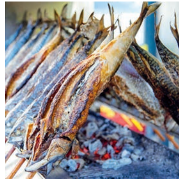
Mit Steckerlfisch lockt der Unterföhringer Wochenmarkt am Samstag, 9. Juli.