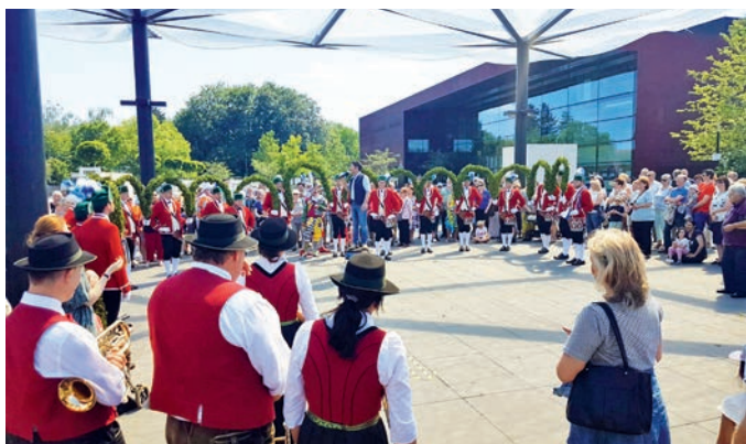
Die Aschheimer Schäffler tanzten Anfang Juni vor dem Bürgerhaus.

Im Anschluss an die wunderbare Darbietung gab es noch eine kleine von der Gemeinde spendierte Brotzeit für Tänzer und Musiker, bevor diese dann, gut gestärkt, zum Ausklang der Saison zu weiteren Auftritten in Aschheim selbst aufbrachen. Herzlichen Dank nach Aschheim!