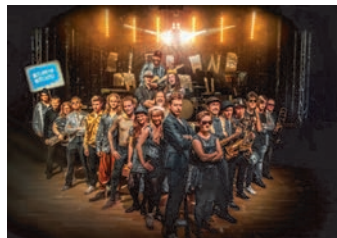
Das furiose Dachauer Bigband MassivJazzTechno-Ensemble spielt am Sonntag, 3. Juli.