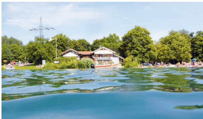
Unsere Wachstation am Feringasee.

Du willst Dich an heißen Sommertagen nicht einfach nur in der Sonne bräunen, sondern auch anderen Menschen in Not helfen? Dann komm doch gerne mal bei uns am Feringasee vorbei! Wir suchen aktuell nach Verstärkung für unser Team. Bei Interesse erzählen wir Dir gerne mehr über unsere spannende Arbeit im und am Wasser.