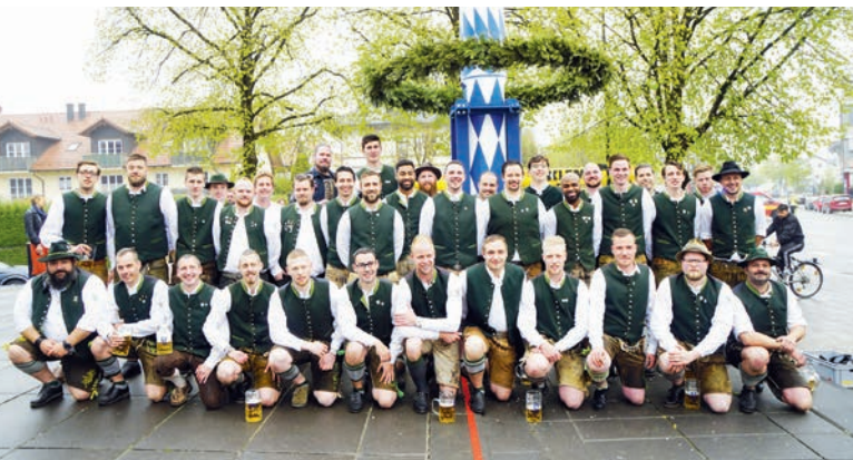
Die Unterföhringer Burschen laden ein.