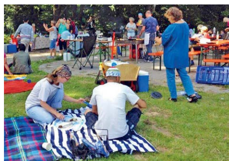
Unser letztes interkulturelles Sommerfest.

Am Sonntag, 19. Juni , feiern wir am Grillplatz an der Aschheimer Straße von 14 bis 20 Uhr wieder unser interkulturelles Sommerfest für alle aus Unterföhring. Es gibt Essen von Allen für Alle!