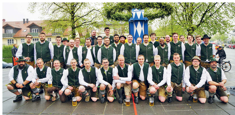
Die Unterföhringer Burschen freuen sich auf ihre Gäste zur Feier der Fahnenweihe

Am Sonntag, 3. Juli feiern wir am Feststadl, Etzweg 12, von 9 bis 10.15 Uhr den Höhepunkt des Wochenendes, die Fahnenweihe . Anschließend gibt es einen Fahnenumzug durch Unterföhring und nach dem Mittagessen im Festzelt ist Party angesagt. Die Partyband „Rockwave“ wird dabei die Stimmung zum Kochen bringen.