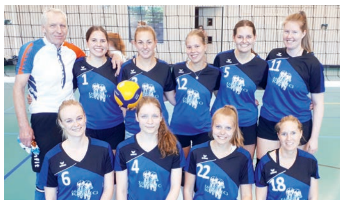
Die Damenmannschaft mit ihrem neuen Sponsor.