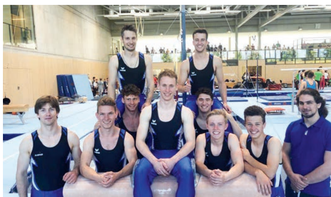
Der TSV Unterföhring II turnt in der Landesliga.

Am 22. Mai fand erstmals seit zwei Jahren wieder ein Liga-Wettkampf unserer Turner statt. Die 2. Männer-Mannschaft des TSV Unterföhring landete aufgrund zu vieler kleiner Fehler auf dem 5. Platz. Trotzdem stimmten die nach so langer Pause erbrachten Leistungen zufrieden. Und so schauen unsere Turner zuversichtlich auf den 2. Landesliga-Wettkampf am Samstag, 16. Juli in Stadtbergen.