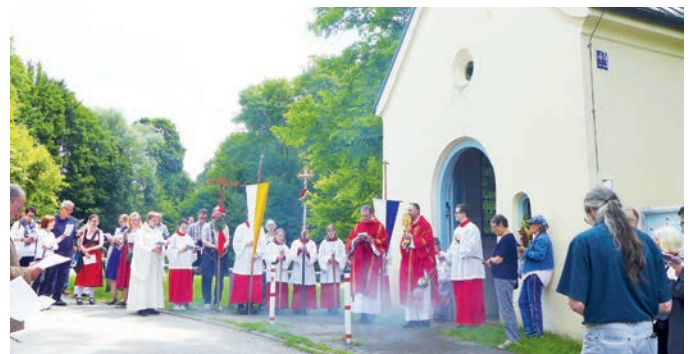
Bittgang zu Ehren des Hl. Emmeram.

Der Heilige Emmeram war im 7. Jahrhundert zunächst Bischof von Poitiers in Aquitanien und gelangte auf einer Missionsreise nach Regensburg. Die Legende erzählt von seinem Martyrium in Kleinhelfendorf. Der tödlich Verwundete verstarb auf dem Transport durch seine Getreuen in der Nähe von Feldkirchen. In Aschheim vorübergehend beigesetzt, wurde der Leichnam später exhumiert und auf der Isar bis nach Regensburg überführt, wo er in allen Ehren zur letzten Ruhe gebettet wurde. Die kleine Kapelle St. Emmeram in Oberföhring erinnert an ihn.