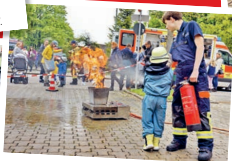
Brandschutztraining für Groß und Klein. Üben am Firetrainer mit dem Feuerlöscher.