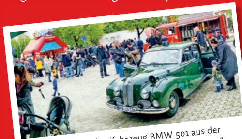
Oldtimer-Polizeifahrzeug BMW 501 aus der 60er-Jahre Fernsehserie „Funkstreife Isar 12“.