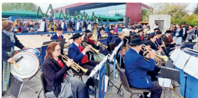
Die Blaskapelle bei den Trachtlertänzen.