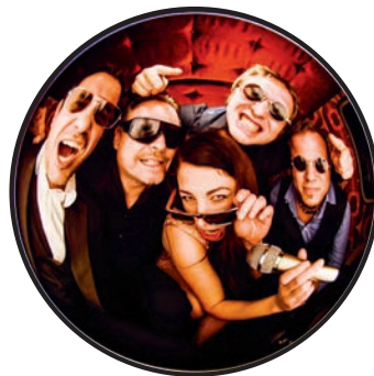
Die Münchner Jazz-Band The Movement.

Für die Kulinarik sorgt der Unterföhringer „Unverpackt-Läden UFC“. Es gibt viele leckere kalte und warme Speisen, eine große Auswahl an Getränken sowie Kaffee und Kuchen.