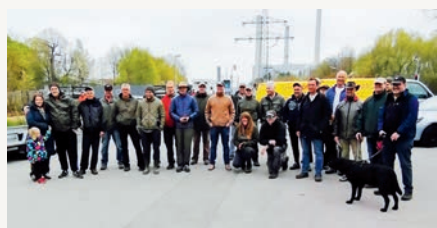
Die 30 Isarfischer:innen trafen sich am Parkplatz an der Leinthaler Brücke.

Besonderer Dank geht an den Modelleisenbahnverein und an die Isar-Fischer, die tatkräftig angepackt haben, sowie an Bündnis 90/Die Grünen.