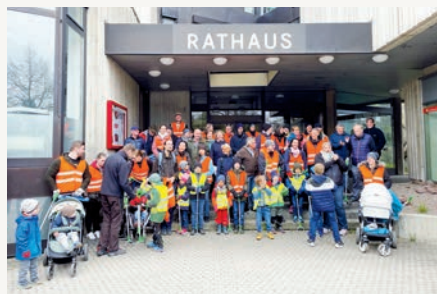
Treffpunkt war um 9 Uhr am Rathaus.

Über 80 sammelwütige Unterföhringer:innen folgten vergangenen Samstag unserer Einladung und haben - nach zwei Jahren Zwangspause - beim diesjährigen Rama dama mitgeholfen. Auf insgesamt elf verschiedenen Routen wurden allerhand Müll, Schutt und Unrat gesammelt. Nach getaner Arbeit wartete eine stärkende Brotzeit auf uns, und die Kinder erhielten als kleines Dankeschön noch Föhri, den Umweltwurm überreicht.