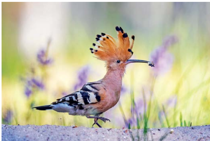
Ein echter Blickfang ist der Wiedehopf.

142.000 Wähler:innen haben ihr Urteil gefällt. Der Wiedehopf ist der Vogel des Jahres 2022. Der auffällige Zugvogel mit gestreiften Flügeln, aufstellbarer orangefarbener Haube und langem Schnabel ließ bei der Wahl des Naturschutzbundes (NABU) und des Landesbundes für Vogelschutz in Bayern seiner Konkurrenz keine Chance: Mehlschwalbe, Bluthänfling, Feldsperling und Steinschmätzer lagen zehntausende Stimmen hinter dem Wiedehopf. Der auffällige, aber scheue Vogel tritt damit die Nachfolge des Rotkehlchens an, das 2021 als Vogel des Jahres geführt wurde.