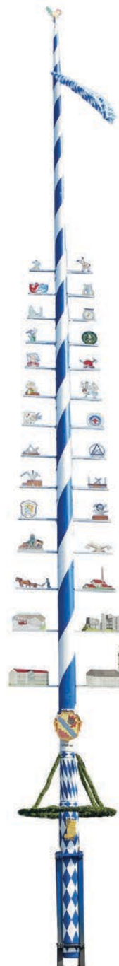
Maibaum 2016.