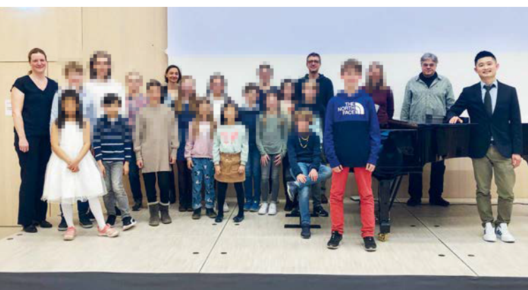
Die Interpreten des Abends im großen Saal.

Unser erstes Schülerkonzert nach den langen Monaten des Wartens auf eine Entspannung der pandemischen Lage wurde von unseren Klavierlehrkräften unter der Federführung von Herrn Tsai als „Klavierfestival“ geplant und realisiert. Zudem stellte sich der neugewählte Vorstand bei diesem Konzert erstmals den Eltern vor.