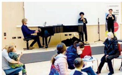
Einen musikalischen Willkommensgruß gab es für geflüchtete Ukrainer.

Wir freuen uns, dass wir ein wenig Licht in das Leben der Geflüchteten bringen konnten. Hoffen wir, dass dieser unsinnige Krieg bald zum Ende kommt und die Ukrainer:innen in ihre Heimat zurückkehren können. Gerne können Sie unserem kleinen Willkommensgruß auf der Website unter „Aktuelles“ lauschen.