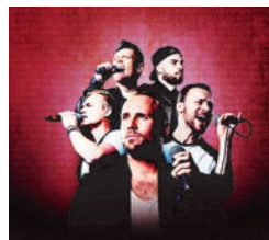
80s Rewind im Bürgerhaus.

Umwerbende Harmonien und atemberaubendes Beatboxing: The Magnets, die fünfstimmige und äußerst charmante A-Cappella-Soundmaschine aus Großbritannien, entführt das Publikum am Freitag, 6. Mai , 20 Uhr, im Bürgerhaus auf eine Reise durch die Hits der 80er von Bryan Adams und Roxy Music zu Prince, Chaka Khan, AC/DC und vielen anderen.