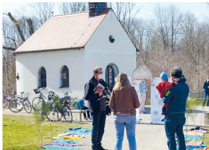
Den Weg Jesu nachgehen: Palmsonntag für Familien in der Kolomansau im vergangenen Jahr.

die Leute für Jesus auf den Weg gelegt haben. Ein Stadttor führt nach Jerusalem hinein. Eine musikalische Begleitung ist in Vorbereitung, und vielleicht wird sogar ein echter Esel dabei sein. Kinder und alle, die es werden wollen, können so den Weg Jesu nachgehen und vielleicht auch ein wenig nacherleben. Dazu wird das Evangelium vom Palmsonntag erzählt und Palmzweige werden gesegnet - zusammen mit den Menschen, die sie mitbringen.