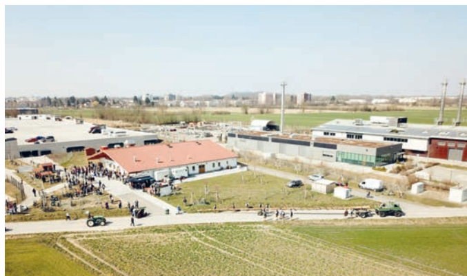
Ankunft Maibaum am Feststadl.

Übrigens: Auch bereits verheiratete Männer sind willkommen. Als passives Mitglied kann man dem Verein finanziell unter die Arme greifen und auch bei den meisten Aktivitäten unterstützend mitwirken.