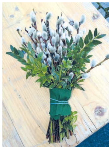
Schöne Palmbuschen werden für einen guten Zweck verkauft.

Am Palmsonntag, 10. April gibt die Katholische Frauengemeinschaft gegen eine Spende geweihte Palmbuschen ab. Ebenso kann man geweihte Palmstecker und Osterkerzen erwerben. Sie treffen uns ab 8.30 Uhr vor dem Gottesdienst um 9 Uhr unter dem Marktdach des Bürgerhausplatzes.