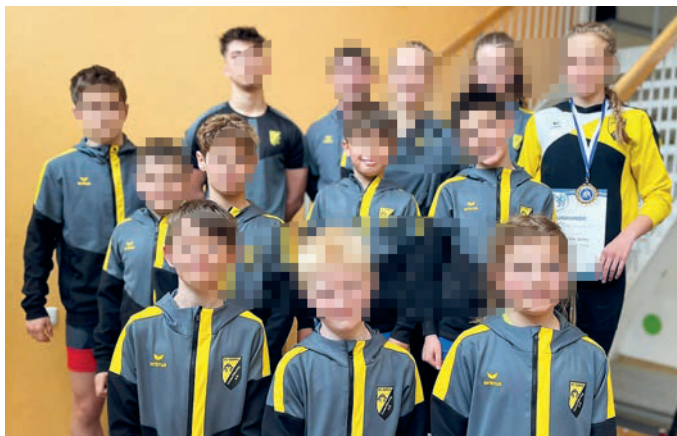
Ein paar der Nachwuchsringer in Burgebrach.