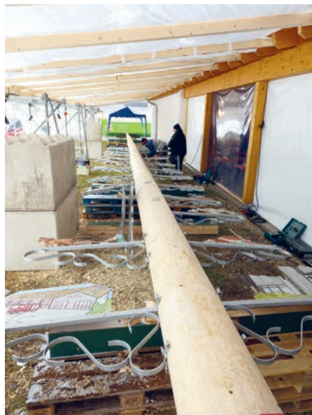
28 Taferl hat der Maibaum.

Ilse Geier im Namen der beteiligten Vereine