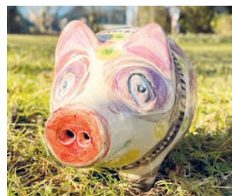
Das Schweinderl nimmt jede kleine Spende freudig entgegen.

In allen 29 Rathäusern der Landkreisgemeinden warten die Spenden-Schweinderl darauf gefüttert zu werden. Kommen Sie vorbei: Unser Schweinderl steht im Rathaus an der Bürgerinfo.