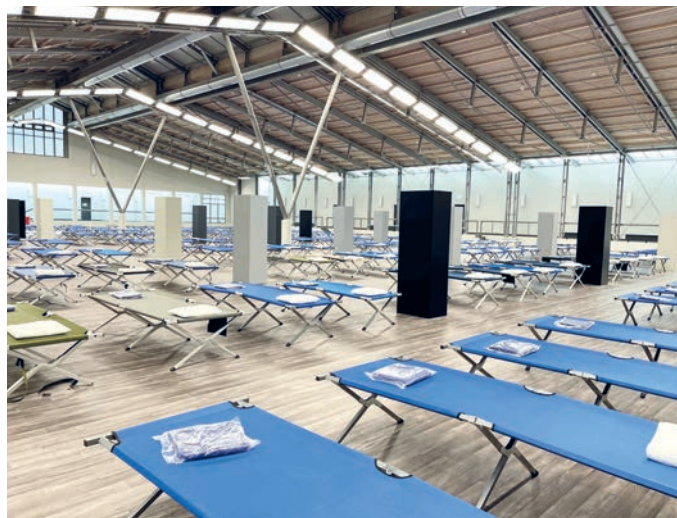
Die Tennishalle im Sportzentrum an der Jahnstraße wird zu einer Notunterkunft für Geflüchtete.

Auch in Unterföhring bringt der Landkreis München geflüchtete Menschen aus der Ukraine unter. Im Comfort Hotel an der Bahnhofstraße haben bereits Menschen Unterkunft gefunden - bis zu 150 können es nach und nach werden. Auch die Tennishalle an der Jahnstraße wurde vom Landratsamt ausgewählt und wird derzeit zu einer Notunterkunft umgebaut. Ein Boden wurde gelegt, die Freiwillige Feuerwehr stellte vergangenes Wochenende Feldbetten und Spinde auf, die Gemeinde organisiert Trennwände. Hier sollen bald weitere bis zu 150 Menschen eine vorübergehende Bleibe finden. Die Belegung beider Unterkünfte liegt in den Händen des Landratsamts.