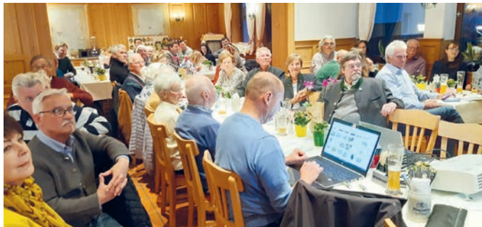
Die Jahreshauptversammlung des Gartenbauvereins war gut besucht.