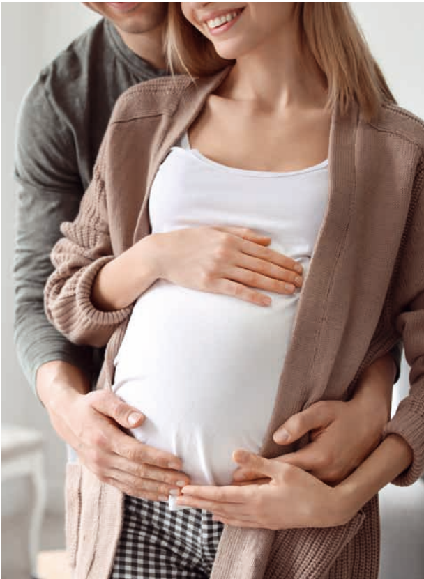
Coverabbildung: Freepik.com; Fotos: Freepik.com (1), Adobe Stock (3), Plan: Tausendblauwerk.de

Ihre Unterstützung beim Elternwerden und Elternsein