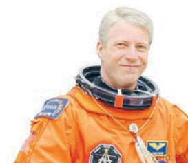
Hauptredner ist der ehemalige Astronaut Dr. Thomas Reiter.

Der Deutsche Philologenverband lädt am Samstag, 4. Mai um 9.30 Uhr zur Veranstaltung „Faszination Weltraum“ in unser Gymnasium ein. Auch die Öffentlichkeit ist selbstverständlich herzlich zu dieser Veranstaltung eingeladen. Schülerinnen und Schüler des Wahlkurses Astronomie übernehmen als Schüler-scouts die Betreuung der Gäste.