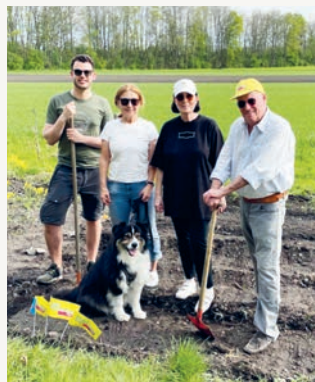
Liberaler Kartoffeln.