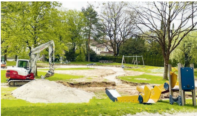
Umbau zum inklusiven Spielplatz an der Aschheimer Straße.

Auch beim Spielplatz am Dorfangerweg werden bislang gerne genutzte Spielgeräte erhalten. So wird es auch weiterhin die Seilfahre, die Kletter-Rutsch-Kombination, den