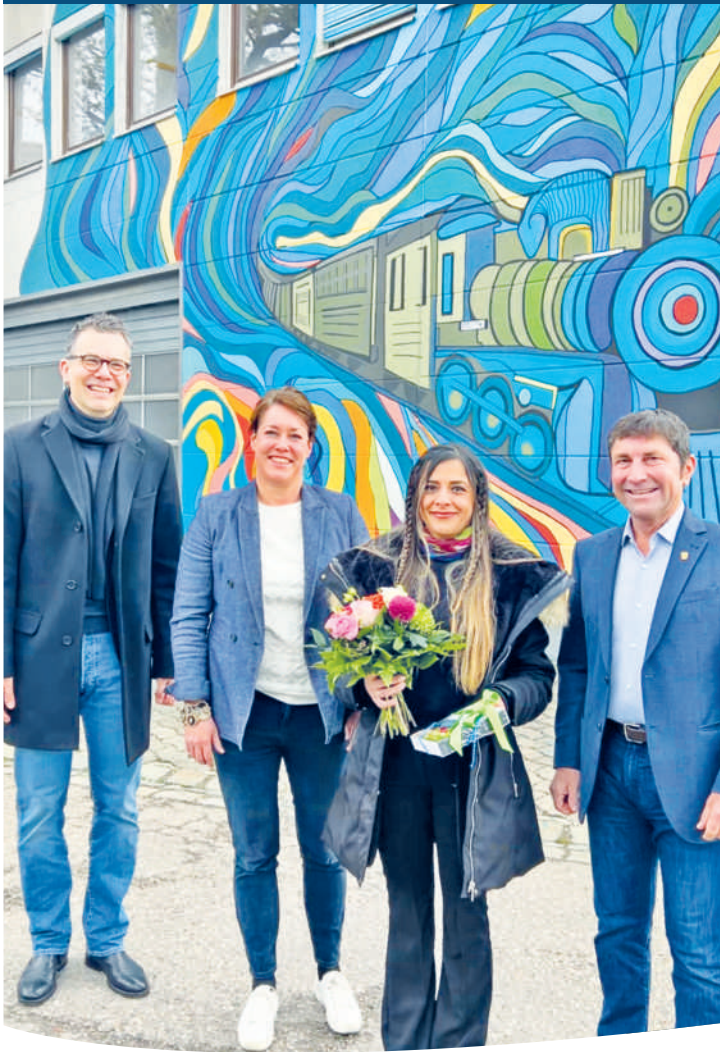
Vorher - Nachher: Das gelungene Mural (Wandgemälde) an der Föhringer Allee 5.