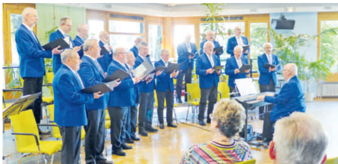
Der Männergesangverein im Feringahaus.