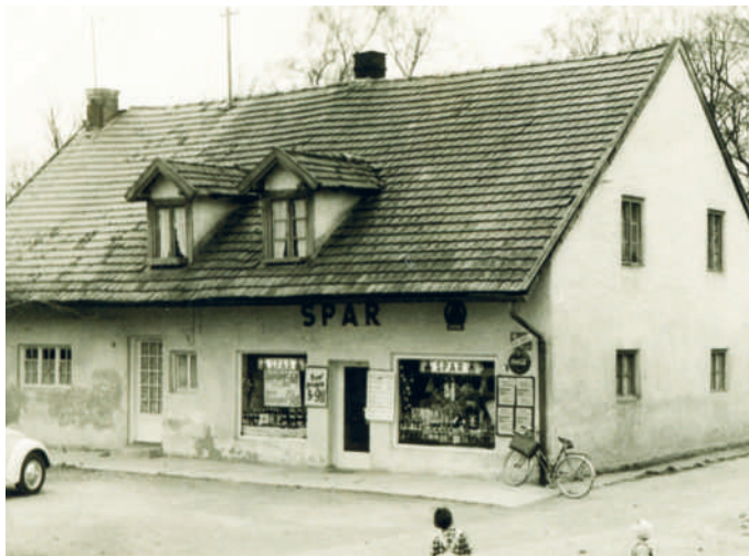
Die Kanalstraße 4 mit dem ehemaligen Spar-Geschäft.