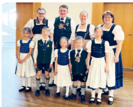
Unsere Kinder und Jugendlichen waren mit dabei in Haar.

Am 28. April trafen sich die Kinder und Jugendlichen aus allen Vereinen des Trachtengaus München und Umgebung zum Gaujugendtag im Bürgersaal in Haar. Los ging es gleich in den vorher ausgewählten Workshops Volkstanz oder Spielen mit den Kuhglocken, wo einiges erarbeitet wurde. Gleichzeitig wurden die anwesenden Eltern und Zuschauer im Eltern-Workshop an (neue) Volkstänze herangeführt. Der offizielle Teil wurde dann mit dem traditionellen Auftanz mit allen Anwesenden eröffnet. Danach präsentierten alle Gruppen ihre erarbeiteten Stücke, unterbrochen von allgemeinen Tanzrunden. Am Ende eines langen Nachmittags wurde wie immer in einem großen Kreis „Kein schöner Land“ gesungen und der Tag beendet, was immer eine wunderbar ruhige Stimmung zum Ende des Gaujugendtages bringt.