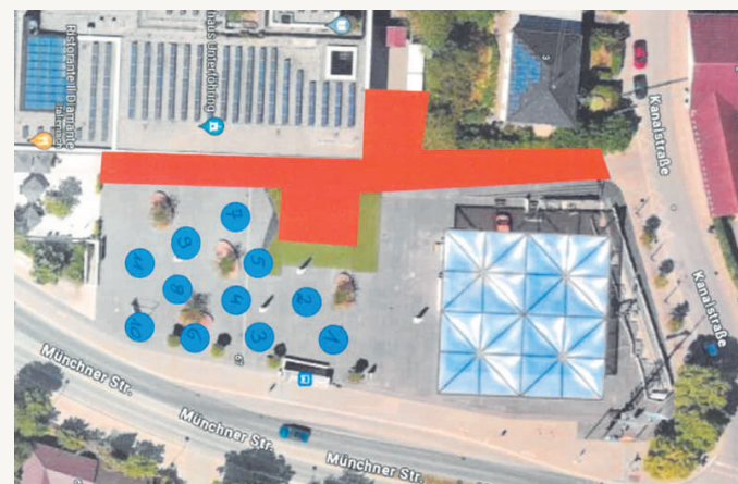
Infostand 1 der FDP vor dem Bürgerhaus. Plan: Gemeinde Ufg/hen

Am Samstag, 4. Mai sind wir mit unserem Infostand von 10 bis 13 Uhr auf Platz 1 der Infostände - gleich neben dem Wochenmarkt. An unserem gelben Tisch gibt es spannende Gespräche und wie immer ein Gläschen Sekt - ohne oder mit Alkohol. Wir freuen uns auf Sie!