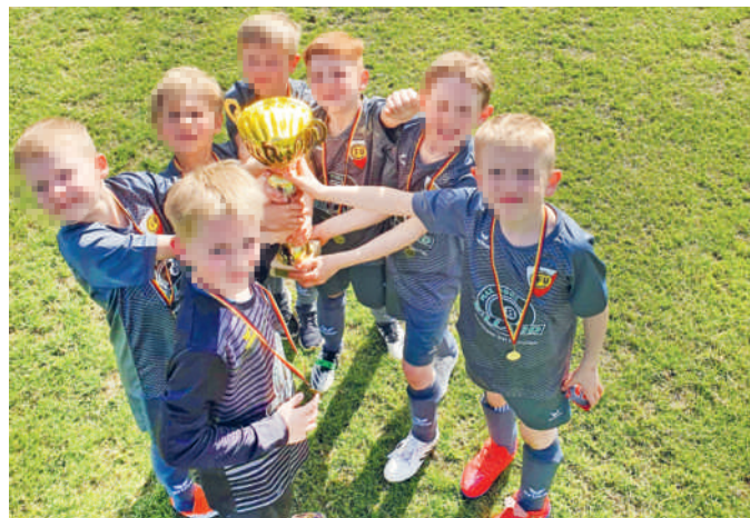
Die U8-Kicker feiern mit der Siegetrophäe.

Erfolgreiches Wochenende für unsere Jugend: Ein Mixteam aus unserer U8-2 und U8-4 bestritt ein Turnier beim ESV München Ost. Die Mannschaft holte sich mit 13:1 Toren, fünf Siegen und einem Unentschieden souverän und ungeschlagen den Turniersieg.