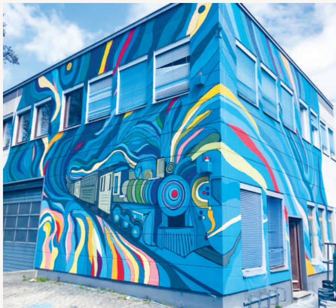
Gelungenes Wandgemälde am Haus der Modelleisenbahnfreunde.